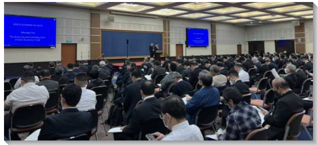
▲ 聖徒於春季國際長老及負責弟兄訓練中交通

第二篇信息說到『信的內在意義』。信，不是盲目的信任，不是虛空的盼望，也不是心理上的認同。信心乃是把聖經所記載的一切神的事實，質實出來，尤其把神新約經綸內容的實際—真理，質實出來。當這信把所質實的真理帶進我們裏面，真理連同這信的本身，在經歷中就對我們成為主觀的了。我們也成為有