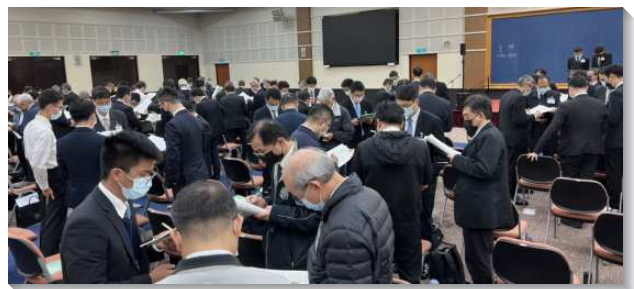
▲ 聖徒於訓練中分組分享

藉著頭兩篇的基礎，從第三篇信息起，就幫助我們看見，我們該有馬可福音十一章二十至二十四節裏所啓示的權柄的禱告。要有那種用權柄來吩咐的禱告，我們就需要以神為我們的信來禱告。第四篇信息則題醒我們，基督徒的一生就是一個賽程，我們必須奔跑這賽程，以贏得獎賞（林前九24）。而完成並完全這賽程所需的信心，乃是藉著不斷望斷以及於耶穌，這位信心的成終者所得著的。這傳輸到我們裏面之信的大能，乃是無法壓制、無限無量的，能推動我們為主受苦，甚至冒性命危險，完成神的經綸。第五篇信息則是說到在召會中為主說話的事。我們是主的見證人必須隨時隨地為祂說話。哥林多後書四章十三節啓示，我們乃是藉著操練信心的靈，說到我們所經歷於主的事，特別是祂的死與復活。