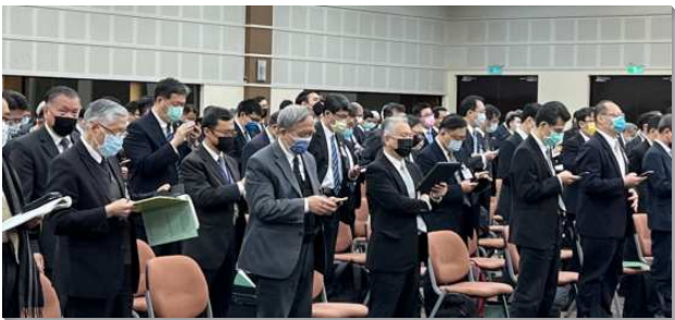
▲ 聖徒參加春季國際長老及負責弟兄訓練

本次訓練共有八篇信息。在負擔的話中，話語服事的弟兄們多次強調，希伯來書十三章七節：『要記念那些帶領你們，對你們講過神話語的人，要效法他們的信心，留心看他們為人的結局。』這節的註解中說到：『神話語的執事們該有一種為人，可以成為信心的榜樣，給召會的眾肢體，就是接受神話語的人效法。這樣，召會的眾肢體就不僅接受他們所供應的話，也效法他們為人所顯出的信心。』這八篇信息對於今日的召會生活可以說是至關重要。