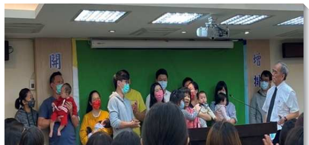
▲北投大區聖徒於會中分享見證

弟兄鼓勵眾人：一、信仰不該停留在宗教生活裏，亦非聖經知識，信仰必須與我們的生活發生關係並影響我們的生活。二、我們的家庭生活要翻轉，召會生活必須作到家庭裏，只過一套生活。三、不要中撒但的詭計，無論如何不能『賣掉』召會生活，這是最優勢的環境，要開創更多的機會來經營家庭生活。四、在家中要操練照著靈而行，不要成為家庭裏的麻煩人物。（謝李光登）