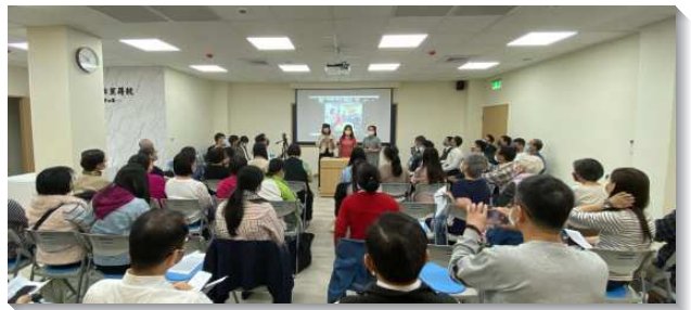
▲信基區兒童服事者及家長事奉相調聚會

弟兄們總結交通，兒童工作在地點、教材、作法與時間都是多方的，也是專特的，需要興起大量姊妹們配搭。會中呼召較老練的姊妹們作『開拓者』形成活力排，為人禱告，然後去配搭、成全新手媽媽建立家聚會。媽媽要與兒女建立親子家庭時光，進而擴展出兒童排。未了也呼召凡是對兒童有負擔的聖徒都能作『幫助者』，不論是年長聖徒，青職、大學生或高中生等，都能參與配搭，讓兒童排能堅定持續的實行並擴增。（朱鍵彰）