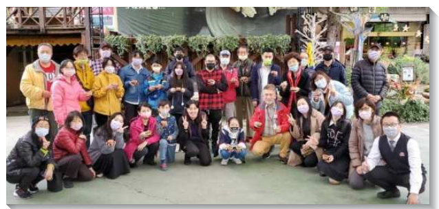
▲聖徒與福音朋友一起喜樂相調

為加強生活照顧小組的實行，弟兄姊妹同心合意邀約福音朋友於四月三日至士林花卉村相調，相調過程喜樂。之後每週都有福音朋友來參加我們的聚會，包含主日會後愛筵，運動相調，及學生們課業輔導等，常常散會後，有人還不想離開會所。四月十七日，文二大區集中的福音聚會，就有福音朋友主動要求受浸。讚美主，聖徒們彼此相愛，且願意更多盡功用，以致全體都事奉，聯絡結合在一起，建造基督的身體。（劉彭路得）