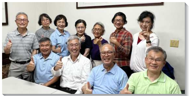
▲壯年班學員至南投鹿谷鄉傳福音

嘉義溪口隊學員們經歷在驚險中帶人得救，隊員們在接觸一位福音朋友時，這位福音朋友的兒子和鄰居起了爭執，分別拿出了鐮刀比畫，其中一把鐮刀丟出去時，就從一位姊妹的面前飛過，蒙主保守無傷，就在這樣混亂又危險的情景中，那位福音朋友隨著開展隊員一同禱告，就受浸了。不僅如此，藉著弟兄姊妹們剛強壯膽的靈，週六晚上的福音聚會，受邀的五位福音朋友全都受浸，顯出神的大能，基督得勝！