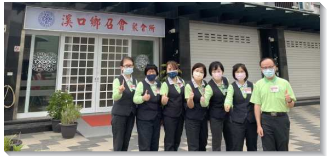
▲壯年班學員至溪口鄉傳福音

台東大武隊的開展更是令人驚奇，總共受浸了十三位。就著外面來看，大武鄉沒有太多的資源，人口外流，聖徒不多。從人的眼光來看，能得救一、二位就很好了。但是開展隊卻經歷到，神的祝福是連搖帶按、上尖下流的傾倒下來。並且這樣的蒙福，並沒有讓大武隊鬆懈，學員們更在週六往北，開了一百多公