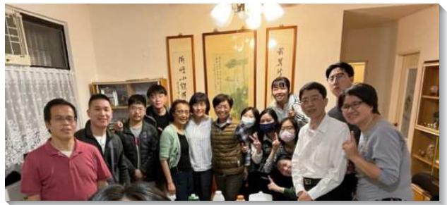
▲聖徒們開家配搭青職排

有位姊妹的弟兄因長期罹患罕見疾病，於四年前離世；五個多月前，她的兒子也因同樣的疾病過世。因著弟兄姊妹扶持陪伴，姊妹從悲傷的情緒中走出來，並積