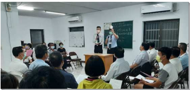
▲壯年班學員與聖徒在屏東萬巒鄉配搭福音聚會

因為疫情的影響，學員們從編隊開始，就迫切為著疫情受管制而禱告，深怕失去這個操練靈、放膽傳講馬路福音、為主爭戰的機會。同時，每一隊也藉著豫備誓師大會，為當地的熱門名單代禱。原本較不熟悉的隊員彼此調心、調靈、調負擔，而能同心合意的往前。在開展的前一週，因著考量疫情，臨時取消了雙北和桃園的開展隊，將原定的二十三隊重新編組為十六隊。甚至有一隊是在學員們週末返家之後，因為某