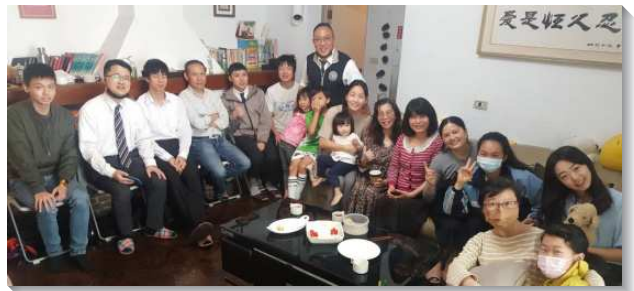
▲聖徒們一同操練活力生活受成全

二、享受牧養（營養包）的蒙恩：藉由教務服事組精心製作的圖卡及影音信息，聖徒每日操練禱告、教導、傳講、勸勉；藉著『聽、說、讀、寫、練、唱』等，以小卡片傳講福音、牧養新人。聖徒們運用圖卡和信息，傳講生命的話語，例如『喜樂的心乃是良藥』的小卡，