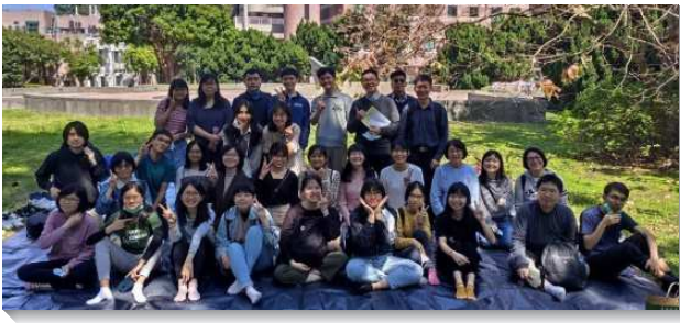
▲學生們陪同新人出外相調

一會所聖徒服事台北市立大學博愛校區。學期初學生們領受校園開展的負擔，開學前藉著學生中幹成全以及期初特會，看見福音不是『人為神發熱心，乃是神給人的託付』。福音的負擔，就是主基督自己。這相當轉變我們對福音的觀念，在眾人的禱告中，福音節期不是向主求外面的果效，或經歷神蹟奇事，而是裏面被基