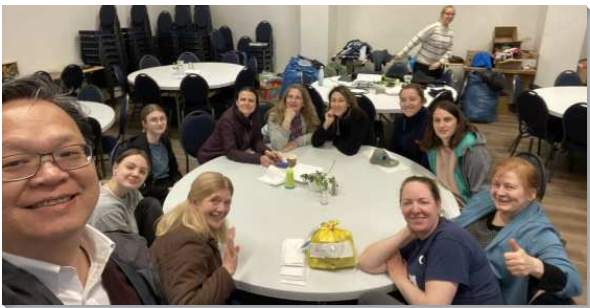
▲聖徒們配搭烏克蘭福音開展行動

當我們抵達德國的美以琳，那裏有約一百位從烏克蘭來的聖徒，大部分是媽媽帶著孩子，還有為數不少的青少年和大專的姊妹。在彼此的交通中，他們見證這是主的手，完全沒有抱怨，並且他們也從聖徒們的服事中看見弟兄相愛。藉著服事者的安排，他們也到東歐幾處的召會訪問，各處的弟兄姊妹都見證，看見這些烏克蘭聖徒有剛強的靈，並在靈裏被充滿而洋溢出喜樂，都深深的被感動！也有一些烏克蘭的聖徒在歐洲各地找到工作，並且開始調進當地的召會生活。