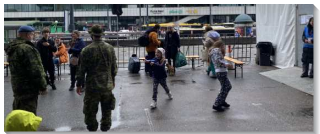
▲各地聖徒至波蘭發送福音關懷包

留在烏克蘭的全時間同工們，在社群媒體上開設了一個生命職事的網路平台，一面提供各地的烏克蘭難民們許多有用的資訊，一面也把福音的材料發送給所有訂閱這個頻道的人。透過掃描關懷包中的二維碼，短短兩週內就有超過七千人註冊並登錄這個頻道。當俄軍正猛烈攻打烏克蘭第二大城哈爾科夫時，透過這個平台，我們有一場為著哈爾科夫居民（從這城出來的人）的線上福音聚會，有三十四位福音朋友參加。同工們相信當這場戰爭結束後，主會在烏克蘭各地興起更多的金燈臺。