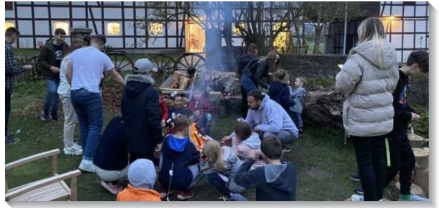
▲聖徒們在德國美以琳服事兒童和青少年

在波蘭我們遇見許多媽媽帶著兒女出來，她們最在意的是兒女，正因為顧到兒女的安全，才會遠離家園從烏克蘭來到陌生的國家。所以在這次的福音行動中，配搭