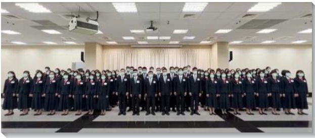
▲全時間訓練呼召聚會於忠義會所舉行

本次呼召聚會的主題為『有分時代轉移，帶進榮耀國度』。國度是神掌權的範圍，使祂能彰顯祂的榮耀，以完成祂的定旨。因此祂需要有一班人自願將自己獻上，