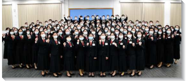
▲全時間訓練學員配搭呼召聚會展覽

聚集中，學員見證，他們如何蒙主呼召，從世界出來，自願將自己獻給神。有弟兄見證，他畢業後的道路與身旁的人大不相同，他不羨慕成為有名望的醫生，卻渴慕成為得勝者，見證在短短的人生中，擺上兩年的時間有分神的經綸，是何等有價值。另有姊妹見證，研究所畢業之際，指導教授開出僅三年即可取得博士學位的條件，讓她的心志受動搖，尋求中，主讓她想起當初簡單的奉獻，她就答應主的呼召，奉獻參加訓練。更有弟