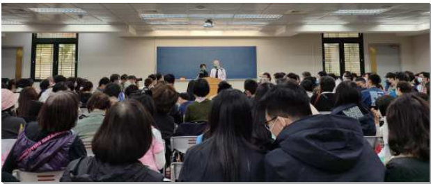
▲聖徒們參加神人生活相調聚會一同蒙恩

藉著相調，就看見已過我們較多顧到小區和大區的服事配搭，對於近兩三年內成立的家，則較少有神人家庭