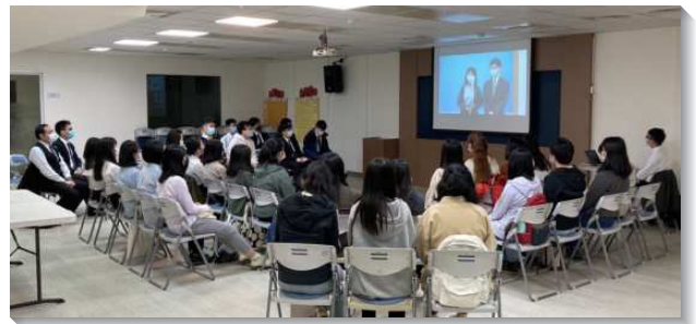
▲各地聖徒聚集參加全時間訓練呼召聚會

撒母耳是自願奉獻的拿細耳人，這個奉獻使他能轉移時代；並且他從小在祭司以利身邊，接受訓練，學習事奉主的路；至終他得著神聖的啟示，甚至成為代表的神。我們要成為轉移時代的人，就當自願奉獻，把自己交在訓練中，這個訓練使我們能完全被分別，在神話語的中心線上跟隨主，把我們的需要聯於神的需要，我們當趁著還有今日的時候，成為討祂喜悅的青年人。