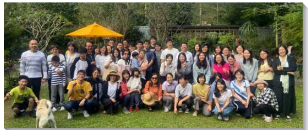
▲聖徒們讀聖經享受主話豐富

提摩太後書三章十六至十七節：『聖經都是神的呼出，對於教訓、督責、改正、在義上的教導，都是有益的，叫屬神的人得以完備，為著各樣的善工，裝備齊全。』藉由讀聖經，使聖徒對主話的胃口被打開，更願意有分一年七次特會信息，細聽那靈向眾召會的說話。聖徒們也更被保守在一裏，有真實的同心合意，能用同一的口，榮耀我們主耶穌基督的神與父。（蔡光豐）