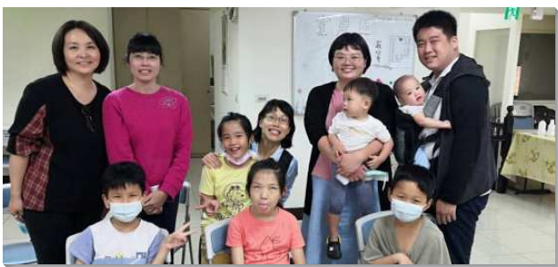
▲聖徒們一同配搭兒童福音

一、幫助每個家建立家聚會，藉著易子而教方式，二至三個家編組，家中的青少年和兒童彼此晚禱，堅