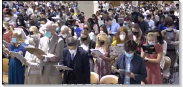
▲二〇二二年國殤節特會於美國加州安那翰舉行

第二篇信息論到『兩棵樹與兩種生活的原則』。創世記二章九節的兩棵樹——生命樹與善惡知識樹——代表兩種生活的原則，這兩棵樹表明基督徒能憑著兩種不同的原則——是非的原則或生命的原則——而生活。當我們接受主耶穌，得著新的生命之後，我們多了一個生活的原則——生命的原則。我們如果不知道，就會把生命的原則擺在一邊，而跟從是非的原則。所以，基督徒不是問事情對或不對，乃是在作事時，問問裏面的