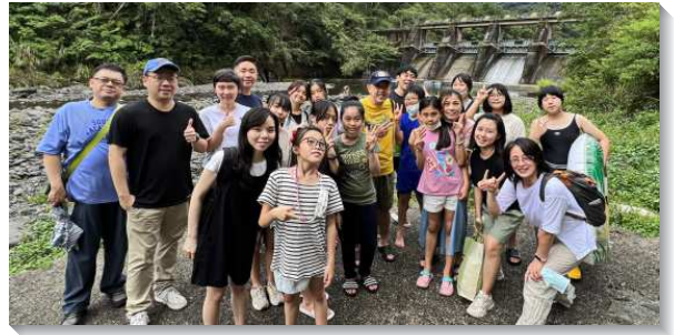
▲服事者牧養成全青少年

為確保每位青少年弟兄姊妹於平日都能充分被餵養與照顧，我們於週間建立緊密的晚禱網，讓每位青少年都