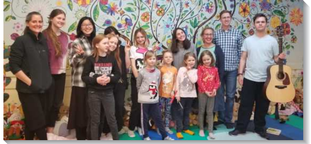
▲聖徒們至波蘭配搭福音開展並作兒童排

這兩週我得著人生中最多來自陌生人的擁抱和許多淚水，以及孩子們在患難中，因著我們的幫助，綻放出燦爛的笑容。當我這亞洲面孔，在火車站嘗試送他們關懷包時，他們都驚訝並好奇我們是誰，不遠千里從台灣來，只為了送禮物幫助他們。即使語言不通，他們感激且不吝惜擁抱我。看著他們從絕望迷茫的表情，轉換成安慰與希望，覺得為他們花費的每一秒都很有價值。