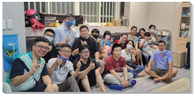
▲青職聖徒們邀約人參加青職排

每週一至週六早上七時，我們都使用網路群組傳送屬靈食物，以神祝福的話供應彼此，並且天天堅定持