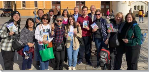
▲聖徒們至波蘭配搭二週福音開展

四月九日，波蘭當地時間下午一時，我們在首都華沙有開展前的豫備聚會。不同年齡、膚色、種族、語言、文化、背景的我們，肩並肩，靈碰靈，同唱詩歌，同讀職事的信息。我們見證能生逢其時，因著異象定準，同在此地作主團體的踏腳石是一件最榮耀的事，眾人亦彼此勉勵並祝福要來兩週的開展能有四活物的配搭。