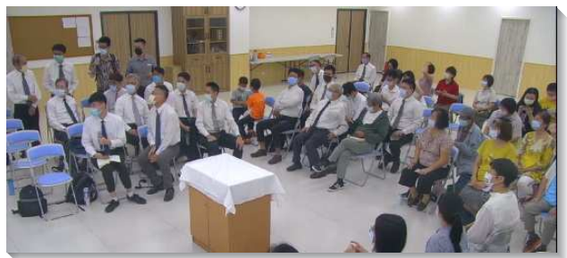
▲聖徒們有分下半年度的展望交通

此外，各區也交通到如何跟上文山一大區當前所帶領的活力生活之成全與操練，特別是聖徒實行彼此相約每日有一分鐘的禱告，即使沒有報名的聖徒也受鼓勵，跟上水流一同有分。一分鐘禱告重在每次禱告時間短、人