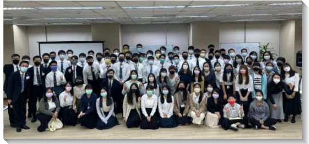
▲第一梯次大學聖徒夏季期末特會

接續的幾篇信息分別從所羅門的來源、智慧和度量、殿的建造以及以色列歷史的悲劇切入。第二篇信息的負擔在於牧養，弟兄點出，列王紀上四章二十節和二十九節都提到『海邊的沙』，一是形容猶大人和以色列人數眾多，如海邊的沙，另一形容所羅門的智慧也如同海邊