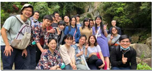
▲青職聖徒們邀約人出外相調

弟兄們為此光景堅定持續禱告，求主開路，去年底開始有突破。去年青職主日基數是十七位，今年校正後為十六位，到了二月增加到二十位，且一直穩定到七月，平均十九位，其中還有四位新人常來參加實體主日。