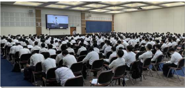
▲高中聖徒中幹成全於中部相調中心舉行

本次中幹成全，彷彿是主為青少年工作開了一扇門，藉著十個大區彼此燈光對照，無論是信息的傳輸、分組的交通、福音牧養的見證，皆擴大青少年的眼界與度量。與會的弟兄姊妹也比照全台一週訓練的服裝，著裝整齊猶如耶和華的軍隊，氣勢盛況空前！