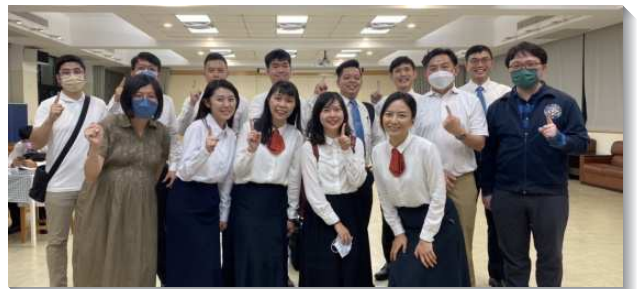
▲青職聖徒參加青職短期全時間訓練

首先，訓練幫助弟兄姊妹建立正常的時間表，每日劃分個人讀經、禱告的時間來被神充滿，主觀的遇見主。密集的真理課程，也開啓了聖徒們屬靈的胃口。有聖徒見證，從前因著召會生活的帶領雖能週週申言，但訓練中高峰真理課程，幫助他們看見主恢復真