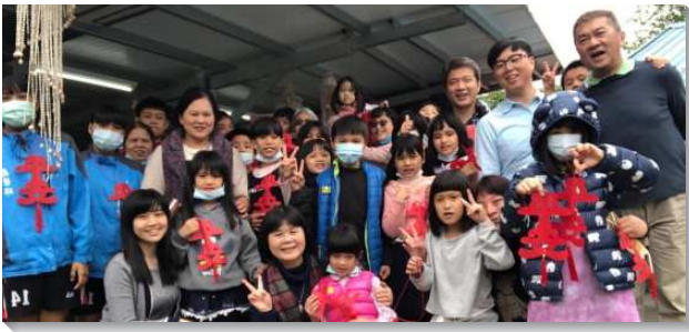
▲聖徒們配搭至萬榮鄉開展

五十三會所和文山一大區宣告於今年十二月十八日要成立花蓮萬榮鄉召會，本會所聖徒響應呼召，今年共有三梯次至萬榮鄉開展，各為期一週。從大專、青職到中壯年的弟兄姊妹，都積極投身在這道水流中，總共有六十二人次前往，一同帶了三人得救。因著要成立召會，牧養著重在小排及兒童排，在為期一週的配搭裏，聖徒分為兩組，第一組探望待恢復的聖徒及福音朋友，另一組則配搭兒童排及主日聚會。