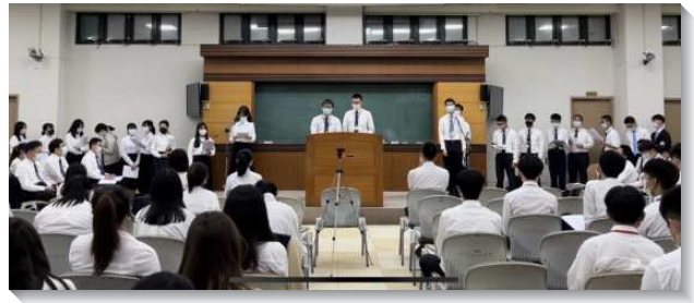
▲高中聖徒踴躍上台分享

其中一位服事者分享他幼年在兒童班長大，他知道如何在表面上使人看他似乎是屬靈的，但是他內心對主卻毫無經歷。直至長大脫離父母管束，便想要走進『迦巴魯河』（結三15）隨波逐流。一次返家與父母交通，父母跪在主前流淚禱告的身影深深觸動他的心，並且與他從小一起長大的同伴在生命上的長進也使他心生羨慕。他知道是聖靈的大風一再的將他吹回到主前，他學習順服內裏的感覺，清理對付自己的罪