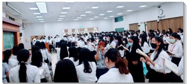
▲高中聖徒們活力且喜樂展覽見證

青少年們看見服事者們申言見證的榜樣，也開始看重為主說話的機會。不只在信息後踴躍上台分享回應，在晚禱時訴說彼此的摸著，更在分組時間禱告尋求，以小組為單位共同豫備展覽聚會的申言稿。