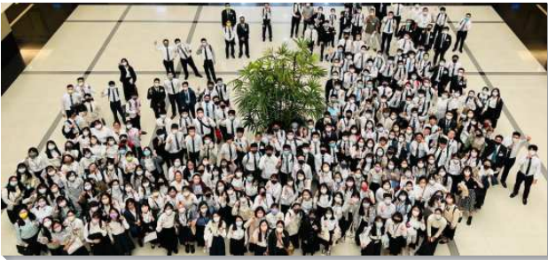
▲ 全台大學新生訓練在中部相調中心舉行

這次訓練信息分為兩個系列，系列一是關於異象和事奉，交通到學生的大學生活及入住弟兄姊妹之家的異象，以及如何在各校園中作神福音的祭司盡功用。現今