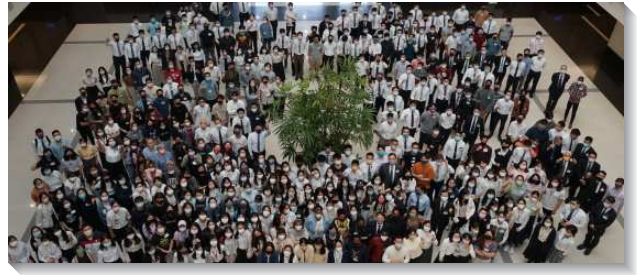
▲ 全台大學外語學生相調聚會

聚會共有兩堂信息，以中文及英文兩種語言同時進行，信息的主題為『禧年』，說出無論我們來自何地，有何種背景，這大好的消息是向著萬邦的，也是世人所需要的，只要簡單相信，就能得著這救恩。一面，作為罪人的我們，就如路加福音裏回到父家的浪子一般，需要接受基督作救恩以得著釋放。另一面，我們接受救恩後，就必須過禧年的生活，喫、喝並享受主，也從主領受託付，向萬邦宣揚禧年。