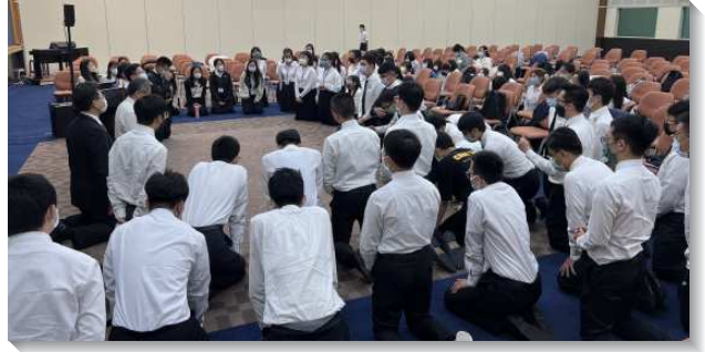
▲ 學生與服事者們一同屈膝禱告

系列二是關於真理，帶領學生進入四卷與以色列人被擄歸回有關的聖經，分別是但以理書、以斯拉記、尼希米記和以斯帖記，其中我們看見四位人物的榜樣：但以理是一個禱告的人，並且藉著神的話語，聯於神的心意，使神得以執行祂的經綸，將以色列人帶回聖地。以斯拉是祭司經學家，精通神的話語，因此神能使用他，用神聖的真理將神的子民重新構成，成為神在地上的見證。尼希米是自願奉獻的拿細耳人，他絕對、完全且徹底的為著神，帶領百姓修築城牆，使神在地上的見證得著加強和保護。神今天在地上需要得著一班自願奉獻的