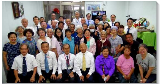
▲ 聖徒配搭富里鄉召會第一次擘餅聚會

富里召會的成立，是弟兄姊妹十多年前作為種子埋下，才能有所收成。本地的聖徒們見證，主差遣許多人來配搭，使召會得以建立。神為富里行了大事，使一位位聖徒歸回羊群。有聖徒見證信主之後，有真正