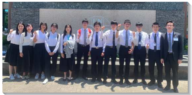
▲ 各校聖徒參加全台大學新生訓練

此外，陪伴新生參加的學生（大二以上）拿起負擔盡生機的功用，在聚會中率先操練靈，會後主動問候不同校園的新生，使得炭火能一直堆加，訓練的空氣也逐漸變得火熱。每晚聚會結束後，有負擔的學生與服事者們仍留在會場，一同屈膝禱告，祈求主在所有的新生身上作工，使每一位都被福音的火焚燒，成為福音的火種，讓主在校園裏得著出路。