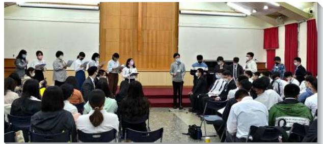
▲大學聖徒於畢業生特會中分享

在長時間禱告開始之前，弟兄們幫助學生認識，禱告時不需要帶著任何的目的，而是單單的觀看並仰望三一神的注入，幫助弟兄姊妹們在禱告中摸著這位榮耀的神。學生們則在禱告後，團體的分享中見證，藉著享受與主親密的交通，接受主的光照，並照著主的引導在主面前有清理與奉獻，與主的關係更進一步。蒙拯救脫離宗教的義務，學習享受與主情深的關係，並藉著與祂是一而同工。第二天午餐特別規劃烤肉相調交通，全時間服事者以及各大區的負責弟兄們，也陪同一起，藉著分享見證以及彼此問答的方式，加強學生們參加全時間訓練及事奉主的心志！