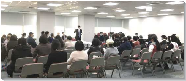
▲聖徒們一同進入高峰真理

自實行起，為使青職們對真理有扎實進入，以『背記標語、重要發表，背唱詩歌』為服事要點。每日安排聖徒配搭『導讀、分享、真理要點、及負擔總結』的服事。藉此青年聖徒屬靈胃口得開，也操練將信息負擔應用於生活中。另加開夜間追求時段，讓全會所青職聖徒，人人都與真理同歡樂。截至追求未了，約