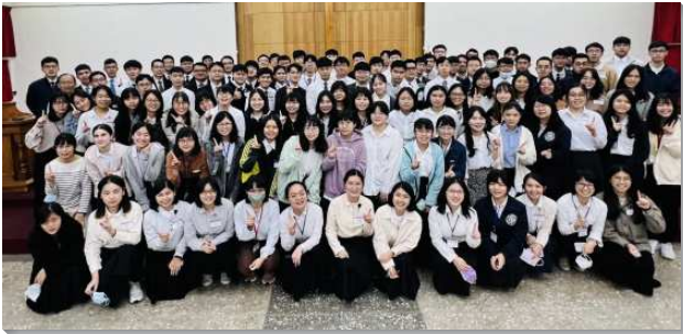
▲大學聖徒參加畢業生特會

第一篇信息交通到『一個最榮耀的人生』，將在神眼中最有價值的人生向學生們開啓。弟兄也擺出諸多的見證，讓學生看見，歷世歷代有許多愛主之人，雖有燦爛的前途、崇高的地位，但都願意枉費在這位可愛的主耶穌的身上。學生們都蒙了光照，對自己原先所追求的人生目標，有了重新的估價，而渴慕在人類的歷史中，能有分神聖的歷史，將自己更新的奉獻給主。