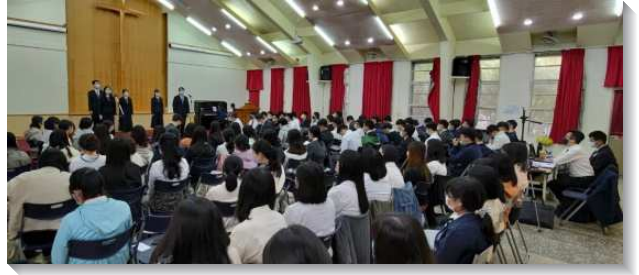
▲全時間訓練學員於特會中作見證

除了信息交通以外，也安排長達一個小時的長時間禱告，盼望學生們能將所聽見的話帶到禱告裏，每一