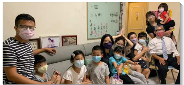
▲聖徒配搭兒童排福音

為了接觸社區裏完整的家庭，在新的兒童排裏，配搭服事的聖徒，皆由夫妻一起投入，操練教導孩子們唱詩歌、講故事。在兒童聚會後，並有『家長時