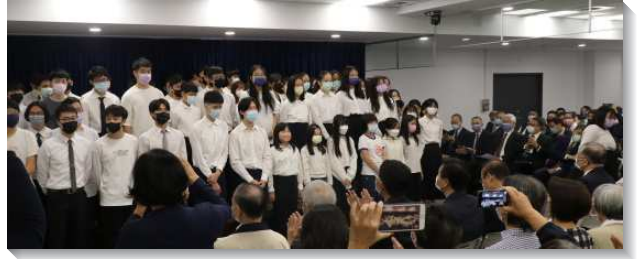
▲學生聖徒於港湖相調中心啓用日展覽

社區的學生工作從小學高年級到大學，每半年有一次福音聚會，成全學生放膽向同學們傳揚福音，為主作見