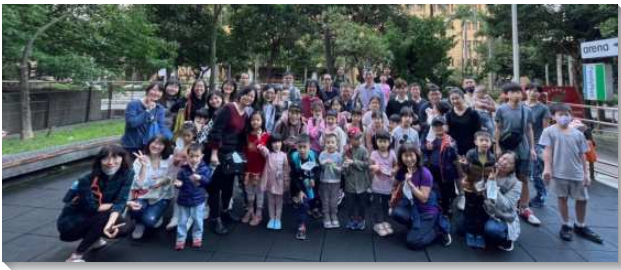
▲聖徒們陪伴兒童參加相調活動

九十五會所於二〇二一年十一月十四日由二十九、五十五、和五十九會所增出，屬文山三大區。由於從三個會所合增，在確認新會所架構後，弟兄們秉持相調是貫穿新路實行的命脈，規畫了各環交通與各式相調。雖受限疫情影響，無法完全釋放，但仍是從中心到圓周開始許多的實體與線上相調，加上網路等資訊工具的應用，無論是從不同小區、小排相調到全會所錄影訓練，或是從兩兩小區用飯到全會所戶外相調，弟兄姊妹