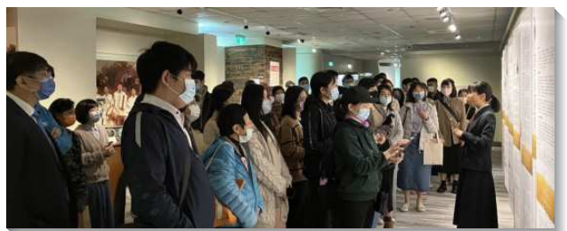
▲信基大區聖徒和新人參觀主的恢復展覽館

第二篇信息說到，召會不是外面的建築物或是教堂，在希臘原文召會是蒙召之人的聚集，也是基督的身體和配偶，是神的家，也是新人。末了弟兄說到，召會既是神從世界所召出來的會眾，就應當常有聚會，聚會叫神所召來的會眾得供應、得建立、得成全，以完成神呼召這會眾的目的。鼓勵新人們能照著希伯來書十章二十五節上所說的：『不可放棄我們自己的聚集』，竭力的參加聚會，尤其是擘餅聚會和小排聚會。願主記念每一位得救的新人，都能藉著本次的新生命之旅，對主話產生渴慕，對聚會有享受，成為常存的果子。（沈世祥）