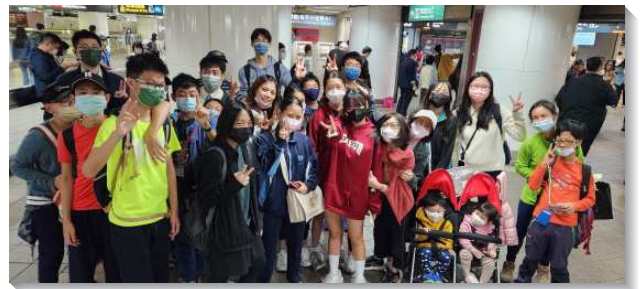
▲聖徒們擴大接觸人得著青少年

第三類，是年長聖徒的孫子女輩。無論他們是否得救，只要沒有過召會生活，就是可以接觸的對象。第