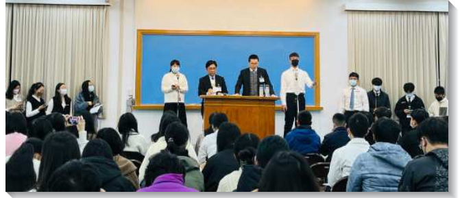
▲大學聖徒於冬季現場訓練中分享

在第七篇啓示尼希米—對神有時代價值之人的榜樣。神渴望得著時代的憑藉，以結束這世代，帶進國度時代。看見尼希米的親身參與，他站在神的話上，並照著神的話禱告。他也在那些豫備與仇敵爭戰的人當中，並有分於夜間的守望。這樣的榜樣鼓勵學生們不只說『去』，而能說『來』。如同希伯來書的作者，來到至聖所、來到施恩的寶座、來到神這裏，而在追求真理、守望禱告、傳揚福音等操練上率先作榜