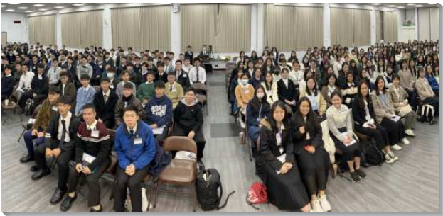
▲大學聖徒們參加冬季現場訓練

本次訓練的主題是『歷代志、以斯拉、尼希米、以斯帖結晶讀經』。訓練開頭弟兄們鼓勵我們運用靈、向主完全的敞開，能有神聖的眼光，看見人類歷史這個外殼裏，如同核仁的神聖歷史，使我們進入歷代志時，如同被擄歸回的人一樣受題醒，來加強我們在美地所過的生活。使這些信息能翻轉我們的人生，以帶進神在人歷史中的行動。第五篇信息說到『祭司經學家以斯拉，以及需要許多以斯拉—精通神話語的人』，在以斯拉記和尼希米記這兩卷書裏，幾乎有一