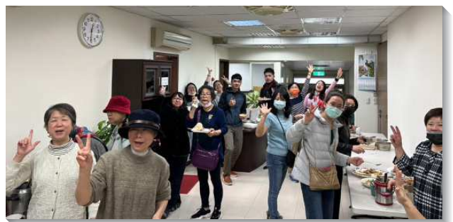
▲聖徒們配搭年終團圓愛筵

這樣的信息實在開啓我們，在新的一年，聖徒們向主禱告，讓我們有新的起頭，進到神的面光中，求主光照。在新年的起頭能碰著神，碰著基督，而有一個新的開始。去年的軟弱、失敗、過錯都已經結束。今年人人都盼望有一個新的起頭，叫我們忘記背後，努力面前的，在這一年竭力贏得基督。（余能信）