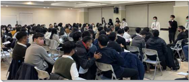
▲大學聖徒參加期末特會

十二月二十五日晚間聚會的專題為『正常基督徒生活』，就是呼吸那靈、喝生命的水、喫神的糧，為著幫助學生在寒假的起頭，能有屬靈的正常喫喝。服事的弟