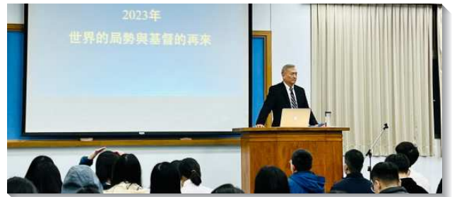
▲大學冬季現場訓練專題交通基督的再來

以斯拉記職事的內在意義可見於『潔淨』、『教育』、『重構』；尼希米的領導中『分別』、『保護』、『彰顯』給予我們驚奇且重大的結晶，就是活