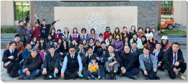
▲聖徒們同心合意承接託付

核心中幹弟兄姊妹，不僅常彼此相調，更著重成全，期盼成為忠信、精明的管家，按時分糧，生機的