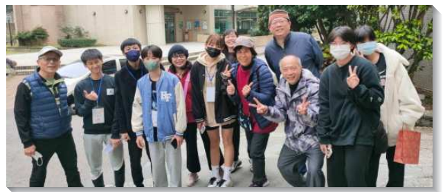
▲聖徒配搭服事得榮少年

之後，每個月也有關懷者到同學家中進行家庭訪問，進一步認識他們的家人。得榮少年的活動也包括寒暑假參與兩天一夜的生命成長園。今年生命成長園在北投的台北城市科技大學舉行，課程內容多元，不僅有烹飪