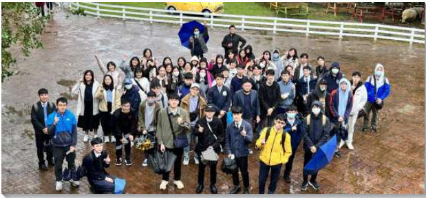
▲城中大同、文山三區大學聖徒期中特會

第一堂信息說到人生的意義與正確的奉獻，第二堂說到愛主之人的三種身份並有使主喜悅的事奉。從神創造人時就能看見人生的意義，在創世記中一章二十六節：『神說，我們要按著我們的形像，照著我們的樣式造人。』神造人時含示神要把自己作到人裏面，