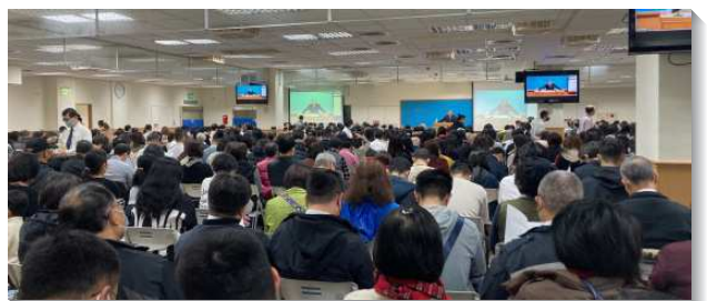
▲文山一大區冬季結晶讀經現場訓練

主的確藉著現今職事的話語，應付召會當前的需要。聖徒們於會後踴躍的分享，也積極參與清早的禱研背講，渴慕進入現今的真理，並被其構成。求主繼續祝福祂的說話，使召會得建造，帶進主的再來。（湯恩德）