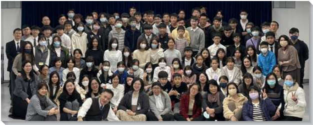
▲港湖區中學生寒假特會

此次特會的主題是『歷代志、以斯拉記、尼希米記、以斯帖記結晶讀經』。共七篇信息：第一篇說到『神在人歷史中的行動，為著完成祂永遠的經綸』，第二篇為『重建神的壇—燔祭壇』，第三篇說到『祭司經學家以