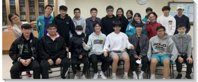
▲聖徒們同心合意服事高中校園排

本會所有優越的地理位置，附近有許多高中和高工。之前因疫情的緣故，會所附近的高中校園排暫停。隨著疫情逐漸趨緩，松山工農的校園排恢復了。藉由幾位在校園中的弟兄姊妹有負擔一直為校園禱告，並積極交通，從第一次十個人聚排成排，至今每次平均有二十多位，來來去去近六十位學生。其中有兩個班級，班上三