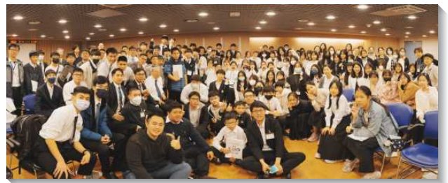
▲文山一大區青少年寒假特會

特會的前兩天，服事者與聖徒配搭接機及相調行程，在過程中有許多突發狀況，使我們經歷在身體裏的彼此相顧，彼此扶持，而更寶貝每個肢體的配搭。