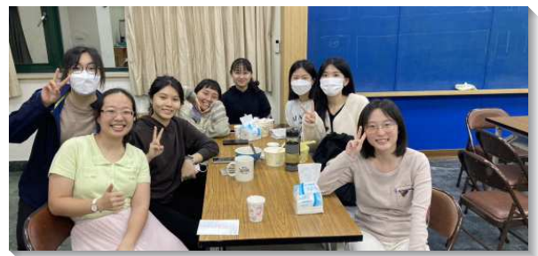
▲大學聖徒領受福音的託付

重點不在於外面的技巧，而在於列出確定的名單，並且為名單上的小羊定時禱告。學生們都有願意操練的靈，每週有二到三次為所牧養的小羊禱告，求主在人身上作工。藉著禱告，我們經歷主是祝福的源頭，開展時，常常遇到已過曾受牧養但還不穩定的小羊；也有小羊和福音朋友來參加福音愛筵與我們一同相調交通，其中有一部分是已過一學期所接觸的同學。在過程中，學生們更抓住機會，約定後續的家聚會。