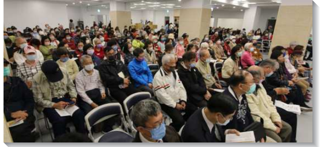
▲生命成全照顧組至港湖相調中心相調

兄們也交通關於港湖相調中心成立的緣由與過程。據服事弟兄所言，李常受弟兄在多年前曾囑咐：要在大湖公園附近購地以應付未來的需要。爾後，弟兄們為落實台北市召會大區治理的負擔，勞苦尋得此產業並購之，幾經規劃、整修後，不僅成為港湖區聖徒們參加成全訓練、相調、休憩的場所，也因鄰近大湖公園、大溝溪親水步道，而成為眾召會與各會所相調的最佳選擇之一。