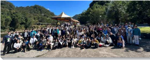
▲城中、中山大同、大安區青少年寒假特會

此次主題為『神殿與神城的恢復』，共三篇信息。第一篇為『從被擄中歸回，重建神的殿』。以斯拉記一章五節說，『於是，猶大和便雅憫的宗族首領、祭司、利未人，就是一切被神激動他靈的人，都起來要