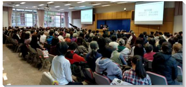
▲得榮少年獎助學金頒發暨福音聚會—台北場

有的地區關懷者陪伴得榮少年多年，不僅從國中至高中六年，甚至高中畢業後仍持續的關懷他們。把少