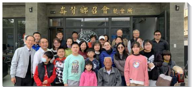
▲聖徒配搭至雲林褒忠鄉福音開展

這段期間，弟兄們一面規劃福音開展方向，同時也尋找合適聚會據點。我們也看見多處都有中型住宅建案正在興工，深深感受到神隱密的手，為著祂在褒忠的見證，正在調度安排將人帶來。求主加強各會所，賜給我們同心爭戰的靈，在同心合意裏喜樂往前！（程曉聰）