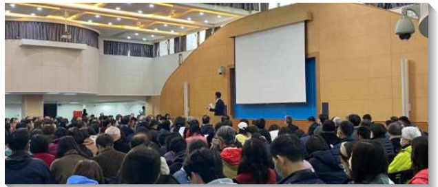
▲ 各地關懷者聖徒見證如何尋訪少年人

第二堂信息交通到『為著召會生活培育青年人』。面對主當前的需要，我們對青少年需要『重』的心情，如同尼希米聽到城牆被毀，城門被火焚燒，就坐下哭泣。我們看見主的權益就有迫切的心，我們乃是為著召會生活培育青年人。首先我們必須喜歡青年人、關心青年人，關注他們的事。其次，我們必須讓神開啓我們的眼睛，看見少年人的寶貴，與在神手中的重要，在平時要和他們多有接觸。得榮少年教育專案製造許多機會，讓我們去接觸一個個少年人，帶他們到召會生活裏。我們需要與三一神配合，不僅自己作，也找同伴一起作。