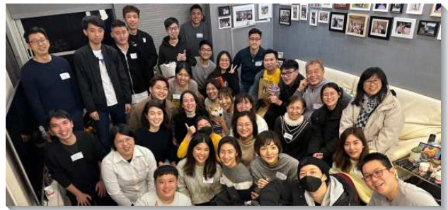
▲青職聖徒在青職排中同受成全

青職排在經營的過程中，我們抓住三個祕訣，第一，神聖之愛的流通：人來到小排，藉著關心和顧惜，使他們感覺到愛和溫暖。第二，神聖之光的照耀：在青職排中，我們操練解開神的話，彼此問、互相答，聖經的話就成為可經歷的活話。第三，神聖旨意的帶領：每次會後，我們就生機的配搭看望，關心