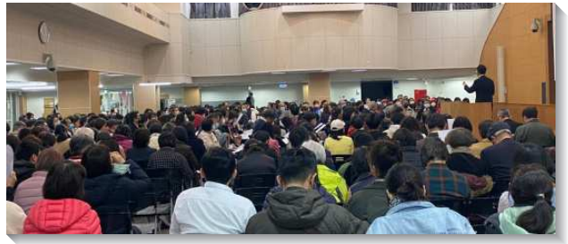
▲ 聖徒參加全台得榮少年關懷者相調聚會

第一堂聚會信息為『為著神永遠經綸尊貴的器皿』。我們乃是為著主恢復中少年人的工作，為著神永遠的經綸，得著尊貴的器皿。我們今天有分少年人的服事要有正確的動機，看見、認識少年人在神手中的價值。為著在主手裏的用途、主國度的開展、和祂工作的推廣，這個責任是在少年人身上。為著轉移時代，主要得著對祂有時代價值的青年。他們不僅聽見