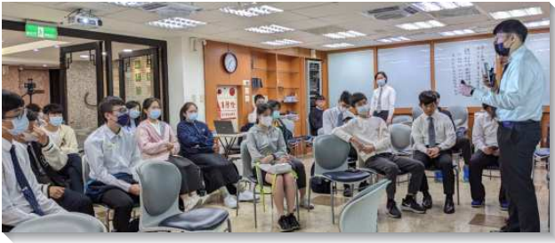
▲各地高中生參加大學博覽會

大學博覽會配合台灣大學行之有年的杜鵑花節，鑑於此時有許多高中生來參觀台大校園。弟兄們就有負擔趁此機會，舉辦大學博覽會擴大接觸學生，也盼望各地召會高中生在升上大學後，能順利銜接大學的召會生活。