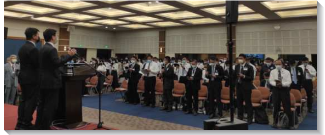
▲聖徒參加春季全台同工成全訓練

第三篇信息說到新耶路撒冷是『一』、聖別的、純淨的、屬新婦的。主恢復的性質乃是一。我們若要活出並作出新耶路撒冷，今天就需要活在基督身體的實際裏，也就必須竭力保守以弗所書四章提及的七個一。所有的信徒既是聖城新耶路撒冷的組成份子，我們就都該被聖別。聖別不僅是分別歸神，也是被神浸透，與神調和。在主的恢復裏，絕不該有任何的摻雜，這恢復必須是絕對純淨、單純並聖別的。新耶路撒冷乃是一個團體的人