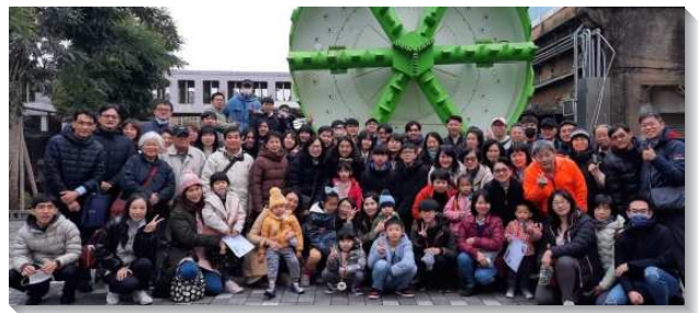
▲聖徒們外出事奉相調

負責弟兄們進一步推動聖徒們操練一年讀經一遍，並利用連續假期舉辦各類相調。繼二月底連假核心聖徒相調後，又在四月初至嘉南美地相調，有超過一百一十人參加，其中有三十七位福音朋友。當晚我們在朴子召會與當地聖徒的愛筵相調，令福音朋友深受感動，對聖徒們熱切的接待留下美好的印象，都樂意日後繼續參與召會生活，願神加倍祝福。（曹正華）