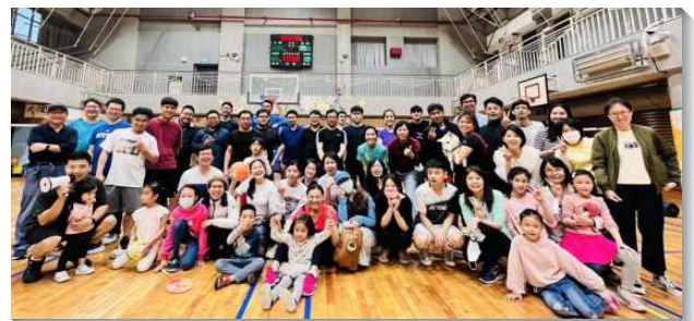
▲青職聖徒在生活中相調

今年本會所跟上北投大區的負擔：『增排增區得青年』。自年初展望交通後，各區週週都為著得青年人禱告。聖徒們也在生活中邀約青年人一同用飯及交通。會所每月也規劃青職日生活相調，拓展接觸青職，並鼓勵青職們參加北投大區青職生命成全、青職職場排，盼望能得著青年人、留住青年人、成全青年人，使召會年輕化，帶進永續繁增。（邱信一）