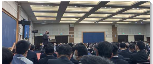
▲聖徒於春季全台同工成全訓練中交通

第五篇信息講到新耶路撒冷的性質，是屬生命、滿了光、變化過、被建造、歸一於一個元首之下、也是榮耀的。今天召會必須被神聖的生命充滿，帶領人以活的方式認識神，並以光的方式認識聖經，好使我們經歷新陳代謝的變化，讓神的成分更多作到我們裏面，而被建造成爲一個團體的器皿盛裝神並彰顯神，將榮耀歸神。