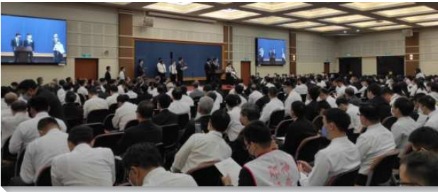
▲春季全台同工成全訓練在中部相調中心舉行

本次訓練的負擔接續冬季結晶讀經訓練，神恢復祂的子民歸回重建聖殿，不僅是立場的歸回，他們更需要被潔淨及重構。在出埃及二十五章，金燈臺是用一塊金子錘出來的，豫表神在基督裏作為祂的見證。在啓示錄，召會也是金燈臺，其性質是神聖的，由精金豫表神的性情。我們能否說我們是主在地上的金燈臺呢？我們需要衡量，生活工作的價值與性能是否與主的性情匹配。