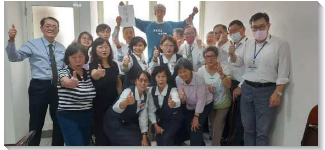
▲學員們到各地傳福音領人受浸歸主

四、同心合意是蒙福的定律。在出外開展前，各地召會就先將他們在當地勞苦經營的福音朋友的名單給我們，使我們在出發前對他們先有了解並代禱。開展隊到