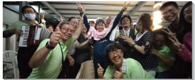
▲學員和聖徒配搭傳福音帶人喜樂受浸

了各地，當地及週邊召會的聖徒都一同前來，大家分別時間，有的配搭飯食，有的傳福音，有的陪家聚會…。每回出門前，編組成軍，齊心禱告讓主領帥，馬太福音十八章十九節說『…你們中間若有兩個人在地上，在他們所求的任何事上和諧一致，他們無論求甚麼，都必從我在諸天之上的父，得著成全』。大家同心合意在市場、公園、學校、捷運站，或是鄉間、山上、海邊傳福音，在一個靈裏，基督身體上的活肢體個個都盡功用，一同配搭征服仇敵，釋放靈魂，將人帶來歸主。有位更生人在監獄中有人向他傳福音，當時他想要受浸，因為疫情無法為他施浸。傳福音的人對他說：『你放心，神會豫備』。就在他出獄五天後，學員叩門接觸到他，邀他來參加週六的福音聚會，會後他歡樂的受浸。