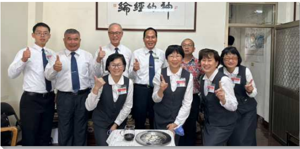
▲輔訓至鹿谷鄉召會看望學員和聖徒

二、先成為活力人、帶出活力的行動。隊員們到了各地，每天藉著晨興與團體追求，先有規律享受主的生活，有的學員天未亮就到海邊呼求主名，仰望主的說話，帶領每天的開展。在收割福音聚會中弟兄姊妹們在靈裏被主充滿，見證自己生命有奇妙的改變、離棄偶像