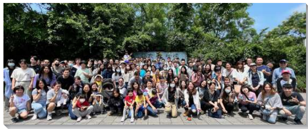
▲文山一大區青職聖徒相調

下午的時間大家參與園區提供的四種不同體驗的活動。參與者可以根據個人喜好選擇二至三種體驗。在活動中，聖徒和福音朋友之間的聯結更加緊密。在活