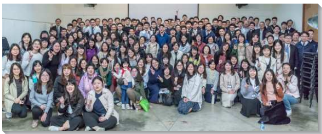
▲大安區青職聖徒參加成全聚會

第一篇信息是『維持那見於新耶路撒冷之主恢復的性質』，帶我們看見並認識，主的恢復是甚麼。我們需要過一種生活，是符合新耶路撒冷的性質，好使我們能維持主恢復的性質。藉著這種生活，也能在忙碌的職場中，一層一層的上，而成為新耶路撒冷裏的人。