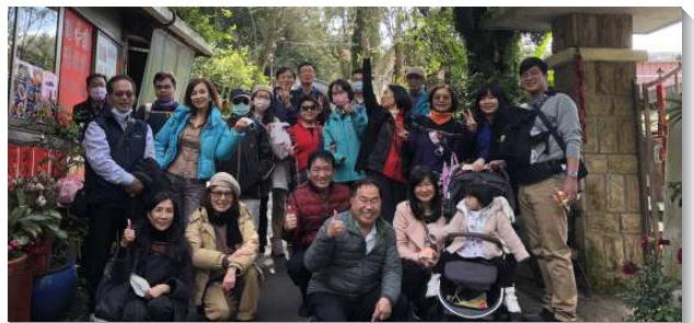
▲各小排聖徒喜樂出外相調

每排人數實體加線上平均人數在十二至十三位上下。以現況說到要增排，信心有些不足。但弟兄們不憑眼見，在同一個靈裏，盼望人人都入排，個個盡功用，我們就從四個排慢慢繁增至目前的八個排。這期間各個排都有許多的禱告與交通，也因著疫情有些趨緩，聖徒們就有許多的小排相調，如愛筵相調、戶外相調。慢慢的，聖徒們也都能在小排中盡生機的功用。因此不僅小排人數增加，從平均六十人增加到八十人以上，主日聚會的人數，在今年開始亦緩慢的繁增至一百一十五人以上。最喜樂的就是在每次小排聚會中，人人都切慕申言來建造基督的身體。我們為此感謝讚美主，祈求祂繼續帶領並分賜生命給祂的召會，使我們豫備好自己，為著祂的再來。（謝石旺）