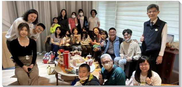
▲聖徒們同心牧養青少年

感謝主，讓我們有機會走入社區。經過交通後，聖徒都很樂意配搭服事，有的聖徒為少年上生命教育課程，有的聖徒擔任少年的關懷者，也有的配搭探訪少年的家長。眾人同心合意，就帶下祝福，今年五月七日福音聚會時，就有兩位少年的家長受浸得救了。感謝神，使我們有分於增區的實行及得榮少年的服事。為實現神繁增之福，我們應當敢求敢想，神必親自成就。（王仁越）