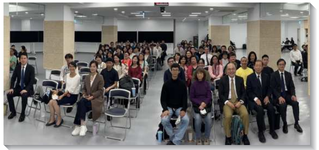
▲港湖區青職特會在港湖相調中心舉行

第二對夫婦見證，如何不被錢財迷惑，並把自己擺進召會生活中。藉著與聖徒一起讀經、禱告、交通，看見撒但正用世界上的事霸佔人，但神造人，是要人愛祂並活祂，以完成祂的定旨。關於尋求工作上的事，他們會與弟兄們交通，尋求幫助，弟兄們也題醒他們要直接求