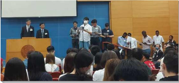
▲學生們參加全台大學外語生相調聚會

—— 〇二三年全台外語學生相調聚會，於四月二十九日在台中復興大樓舉行。這次聚會共有四百二十四位與會，其中包含一百五十一位外語生，分別來自二十八個國家。繼二〇二一年六月，召會成立『外語學生福音工作』專項以來，各大學院校的聖徒和學生們都積極在校園中向外語學生傳揚福音，尋找並牧養對真理有渴慕的學生，盼望這些學生回到世界各地後能作為福音的種子，將這份職事帶往全地。