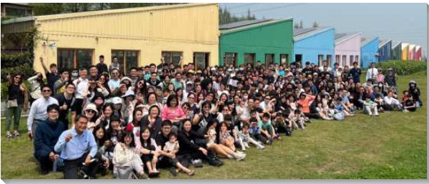
▲聖徒們喜樂外出相調

能回到實體的召會生活，並能形成活力排，傳揚福音。首先，安排各類豐富的相調行程，使聖徒們調在一起，重溫實體的召會生活的甜美。聖徒們在手作點心、烤肉與收割農作物的活動中一同配搭，許多人的心都喜樂敞開，加深身體生活與團體交通的實際。