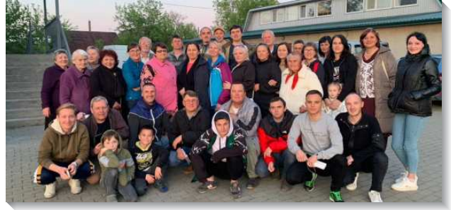
▲聖徒享受基督，得著加力

本次特會內容是已過新春華語特會信息『為著主的來臨將自己豫備好』。聖徒們享受主的說話，切慕愛主耶穌，以祂為生命，活祂，顯大祂，等候主來，並且愛祂的顯現。弟兄們先釋放信息，信息之後再有加強的話，接著是聖徒們的分享。特會的飯食服事，是由幾個年輕