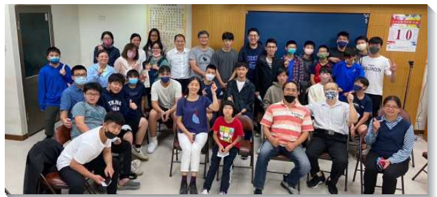
▲青少年於小排中相調建造

盼望主祝福這樣跨會所與大區相調的實行，引導青少年與同伴過召會生活，並帶領青少年的家在召會生活上更有目標和動力，而一起往前。（陳建興）