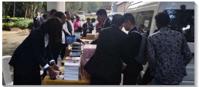
▲聖徒於特會中向尋求者推廣書報

非洲職事書報站（AMD）在這次特會期間也豫備了書報服事，盼望聖徒天天被話中之水洗滌，將自己豫備好。特會總結有兩點蒙恩：一、我們於此次特會出版了第四本繙譯成阿姆哈拉語（Amharic）的書報—『神的經營』，許多聖徒及尋求者來到書報推廣的攤位，翻閱並購入這本職事書報。其中令人印象深刻的是有位就讀於阿迪斯阿貝巴大學（Addis Ababa University）經濟學的博士生來到我們的攤位，他從未聽過神也有『經營』（Economy），我們便與他分享何為『神的經營』。最後，他不只買了書，也與我們約定一同讀聖經。