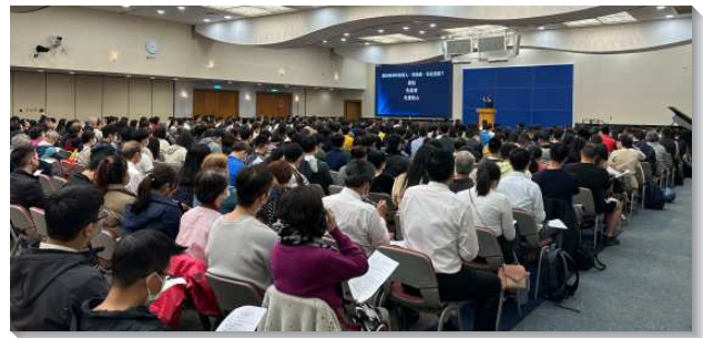
▲信基大區青職福音聚會

整個配搭及聚會非常的蒙恩，大區十三個會所喜樂配搭，各會所豫備三道五十人分的菜，分二個樓層用餐。用餐時交通甜美，難得有這麼多青年人同聚。這是在疫