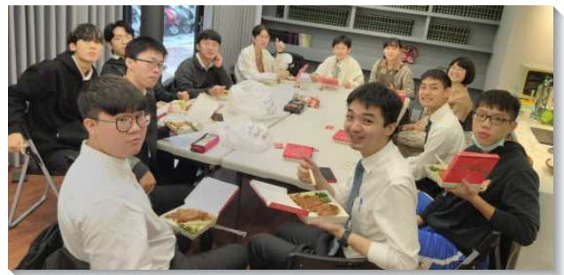
▲聖徒與學生配搭台科大校園服事

在福音牧養上，大學生藉著邀約同學、朋友來到週間的福音愛筵、週末的聖經講座，實際的接觸人、牧