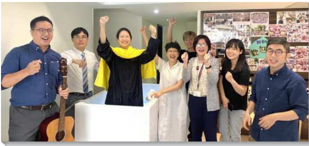
▲聖徒們喜樂傳福音結果子

『冬天已經過去，雨水也止息，再見清新翠綠，大地一片生機』。多時的撒種，如今終於萌芽。每週三晚