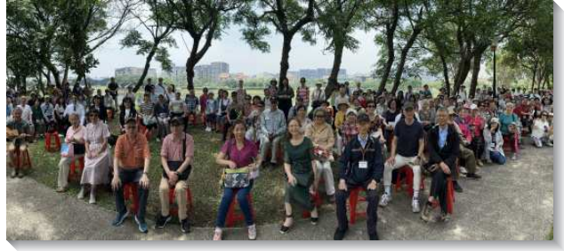
▲聖徒參加生命成全照顧組相調

最後有弟兄的勉勵。各大區讀『來，去，來』的信息，並彼此分享。新約裏有一條路線，叫作『來，去，來』。當主耶穌出來盡職的時候，就呼召人到祂這裏來。主說，『人若渴了，可以到我這裏來喝。』（約七37）。又說，『凡勞苦擔重擔的，可以到我這裏來…得安息。』（太十一28）。四福音給我們看見，主一再呼召人到祂