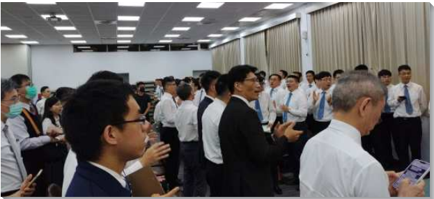
▲青職短期全時間訓練在三會所舉行

本次訓練共有六堂核心課程，內容主要根據『神新約職事極重要的內容』一書，進入十二項重大且緊要的真理，包含使徒的教訓、新約的職事、神的經綸、三一神、包羅萬有的基督、基督在三個時期中豐滿的職事、包羅萬有的靈、永遠的生命、神完整的救恩、基督的身體、召會實際的彰顯和新耶路撒冷。藉著進入課程，學員們對於主恢復中核心的真理有了全面的看見與認識，不僅奠定了基礎，也擴大了眼界。