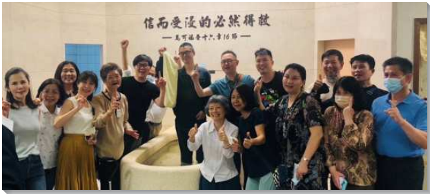
▲聖徒們喜樂傳福音帶人受浸歸主

在真理生命聚會中，我們先一同學習歷屆全時間訓練學員畢業詩歌，藉著一遍遍禱讀、歡唱，眾聖徒靈裏焚燒、滿了喜樂。接著有各區聖徒作得救蒙恩、配搭服事的見證，看見召會生活中美好的榜樣、馨香的見證，弟兄姊妹都相當受激勵，也加深對彼此的認識和珍賞。最