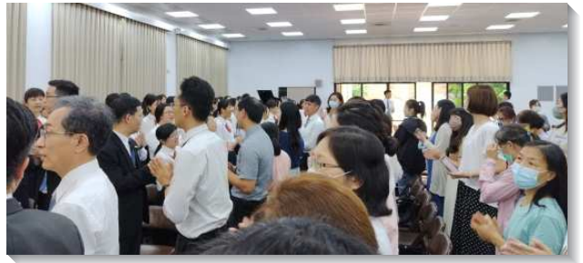
▲聖徒參加青職短期訓練展覽

除了進入各項課程，本次青職短期訓練也比照全時間訓練，在時間規劃與內務整理上都有操練。一開始，緊湊的時間表與嚴格的內務標準，讓學員們常感緊迫。然