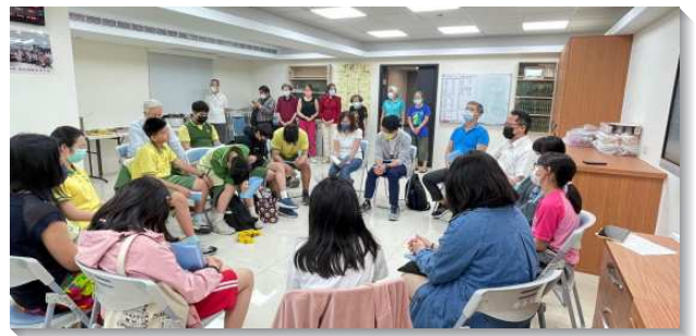
▲聖徒們服事明德國中校園排

青職排的恢復，把分散的青年人重新凝聚，更藉著週週的愛筵，常有新人與福音朋友與我們同聚。在週四下午有姊妹們的詩歌排，許多年長的姊妹們因著台語詩歌，心得溫暖靈被挑旺，更吸引幾位福音朋友，穩定週週同來聚集。今年初，社區排全面恢復，除了