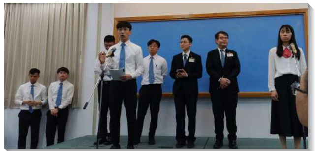
▲青職聖徒分享短期訓練蒙恩見證

訓練期間，還規劃固定的外出開展時段，以及福音收割聚會。開展的過程中，訓練中心鼓勵學員們不要僅僅發放福音單張，更要操練在馬路上使用『人生的奧秘』進行傳講。有些學員從未以此方式接觸人，一開始也相當緊張，但在身體的配搭下就有了突破！此外，在豫備福音聚會上，學員們不僅一同配搭信息、詩歌和見證，更為著邀人前來而迫切題名爭戰禱告。至終，在福音聚會當天，共邀約到二十六人，並有三人受浸得救！