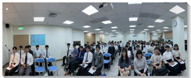
▲大學聖徒第二梯次夏季期末特會

第二篇『藉著留意申言者的話，如同留意照在暗處的燈，直等到天發亮，晨興在我們心裏出現，而為著主的