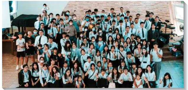
▲文山一大區青少年暑期特會

物及學生、大專、服事者的見證，讓學生們看見同伴的重要，並要在暑期中與同伴一同操練。服事者也設計學習單，讓學生們將同伴的名字寫下，一位學生在列名中就察覺同伴已經許久沒來聚會，裏面就興起負擔，當下就和其他學生建立禱告群組，每週一同為他們禱告。另一位學生原本不想參加特會，藉著服事者與同伴的鼓勵，至終來到會場，她聽到『屬靈同伴』的專題，就深深的被摸著。感謝神量給她許多屬靈同伴，在她不想參加特會時一直扶持她，她也奉獻自己，不只要積極參與青少年的行動，更要扶持其他的青少年一同有分。