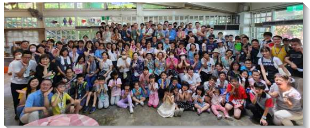
▲聖徒們緊緊跟隨過召會生活

目前會所有四個兒童排，服事者們有跨區配搭，相調著牧養孩子們，週週穩定的帶領孩子們背經節、唱