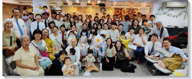
▲聖徒配搭服事台北護理健康大學

二、大學專項，自從國立台北護理健康大學之分部的學生，全部集中回到石牌校區後，學生數增加。目前有三處姊妹之家、一處弟兄之家。學生們樂意接受成全，並與社區聖徒開家配搭，週週有福音愛筵，學生們也竭力禱告、邀約同學前來，一同興旺福音。學生畢業後也願意奉獻自己，參加全時間訓練。目前北