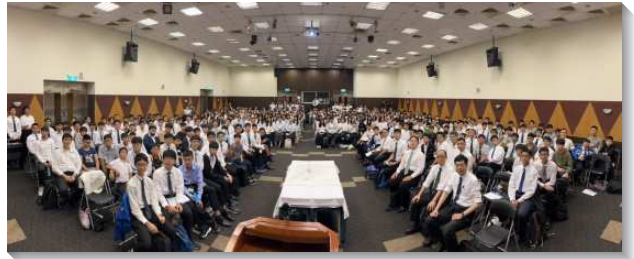
▲文山二、三大區大學生與青少年暑假特會

第二篇是『操練靈的交通，經歷禱讀與禱告享受神』，祭司不只喫嗎哪，還要因事奉神喫陳設餅。陳設餅表徵基督作我們的生命，在聖所中對基督的經