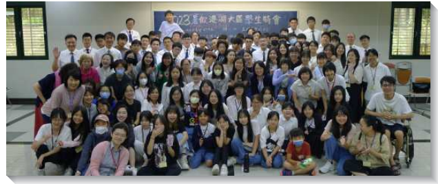
▲港湖大區學生暑假特會

此次特會主題是『照著腓立比書中的啓示經歷基督』。幫助學生逐章進入本書的負擔，並藉著保羅經歷基督的各面榜樣，使我們興起過活基督並顯大基督的生活。除了信息外，活動組設計在關卡中將『人生的奧祕』之內在的屬靈意義，講說並傳輸到眾人裏面。生活內務上也操練不照著自己的習慣，而照著規範來操練性格。晨興的操練上，藉著弟兄們的帶領，從第一天呼求主名和禱讀經節，接著第二天再加上唱詩、禱讀、挑旺靈，到了第三天不僅有個人的呼求，也有團體的享受與操練，藉此享受包羅萬有之基督各樣的豐富。看見學生們竭力操練，實受激勵。