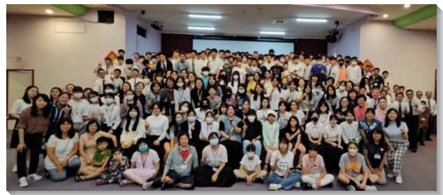
▲城中、中山大同、大安區青少年暑假特會

兩位建中新得救的弟兄，見證他們得救後生命的轉變與感動，激勵了眾人。在『分年級相調』裏，青少年很享受主量給同年級之同伴的甜美交通。『雲彩見