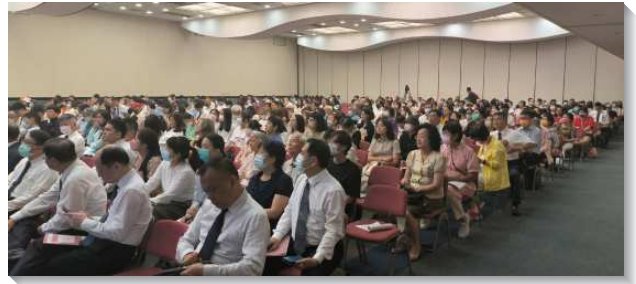
▲信基大區聖徒參加七月半年度現場訓練

聖經好比是一個盒子，而裏面的鑽石是一個啟示，就是神在基督裏成為人，為要使人生命和性情上（但不在神格上）成為神，好建造基督的身體，終極完成新耶路撒冷。