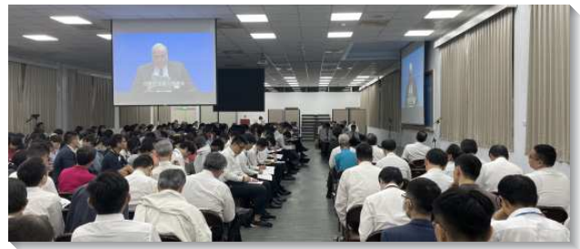
▲大安區七月半年度現場訓練在三會所舉行

本次現場訓練中的第二、五、八、十一篇為觀看錄影訓練。聖徒們無不全神貫注，投入於影片中弟兄們所釋放的信息，也深刻體會所要傳達的負擔。譬如第八篇『在生命中作王』，弟兄就著羅馬書十二章十五節舉出生動的例子，囑咐我們應當與喜樂的人同樂，與哀哭的人同哭。我們必須學習向人表同情，因為我們乃是彼此互相作肢體。弟兄姊妹身上及眾召會中間所發生的事，