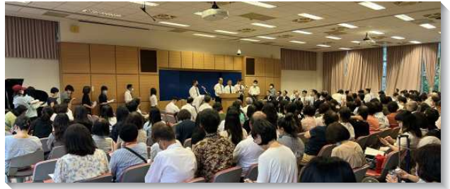
▲中山大同區七月半年度訓練在四會所舉行

從一九七四年至二〇二二年共四十八年的冬夏季訓練，已完成整本聖經生命讀經和結晶讀經，此次訓練的十二篇信息，將李常受弟兄在世旅程的末三年半主所給他看見最精華的部分，也是現有的真理，向聖徒再次陳明。『現有的真理』這辭指搆上時代的真理，乃是為著把主帶回來。對主的恢復中的聖徒而言，這十二篇信息內容並不陌生，不求新鮮的發表。此次訓練我們重溫主的恢復之中心負擔，從神的經綸起始，領我們進入神聖奧祕的範圍，將神自己建造到我們裏面，經歷相調與基督身體的實際，過神人的生活，按