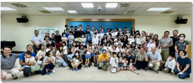
▲聖徒們一同配搭得著更多的兒童

三十三會所自二〇二一年增會所後，為著會所的年輕化及未來繼續朝著增會所目標發展，各個大區都開始規劃並建立兒童、青少年、大專及青職等各專項的服事。在兒童開展上，各大區的兒童人數並不多，但都竭力的擺上。其中五大區，聖徒的兒女只有兩位，近三年因受疫情的打岔，只能從線上兒童排作起。在疫情和緩後，全面恢復回到家中，因著姊妹們