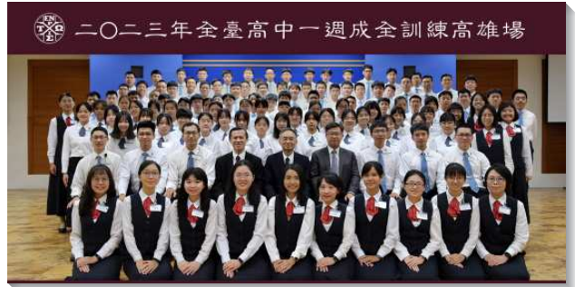
▲高中生參加一週訓練與教師輔訓與服事者合影

訓練的過程中，難免經過流淚谷：有人想家仍忍住不打電話，生活組的輔訓及服事者如同牧者陪伴在身旁，鼓勵與安慰，並一同向主許願奉獻，把握每一有利的時間，『現在』就開始操練突破自己，或與同伴相約一同尋求得以超越！學員們經歷行過高山和低谷，就開始享受泉源之地，不斷轉向祂的眷顧。藉著與同伴彼此扶持，相互勉勵邀約上台分享，或是一同會前禱告，生活組內的同伴一位又一位的突破自己從未達到的操練。這班少年人以奉獻為彩飾，並經歷因同伴的往前而喜樂，