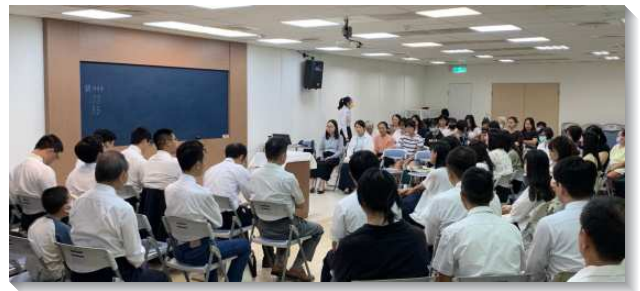
▲聖徒們在集中主日聚會中向主讚美

一位姊妹亦分享在文一大區生命讀經追求中，提及羅馬書是卷福音書，是論到在基督復活之後的福音，表明祂現今是在信徒裏面主觀的救主。所以這卷書更深、更主觀。弟兄姊妹皆受激勵，竭力進入生命讀經的追求。