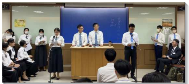
▲高中聖徒在一週訓練中分享

午間系列幫助學生建立個人與主情深的交通。藉著教師及服事者課堂的交通，有禱讀方法的開啓與操練，藉著實際操練長時間的個人禱告，唱詩享受主話的供應，使學員們學習將禱告後所得著的亮光記錄下來。也藉著認罪受對付、主觀經歷主血的洗淨。實際的與家人朋友通話或發信息，賠償禱告中所察覺到的虧欠，操練對神對人常存無愧的良心。除了個人與主來往的一面，也有團體禱告的祕訣與實行、禱告跟隨水流的分解與示範，一同屈膝在主前經歷為全地禱告的爭戰與釋放。除去與主的間隔，並且裏面的人得著釋放後，自然而然福音的靈就被挑旺。學習撰寫福音短信息，課後分享給同學好友，傳揚熟門福音。也在小組的爭戰禱告後，與同伴配搭在馬路上發放福音單張，甚至奔跑上前接觸人，放膽傳講人生的奧祕，無所懼怕！還邀約人參加福音聚會，並由學員們配搭領詩、見證以及福音短講，會後分組生機的陪談交通，經歷在身體中帶人得救！