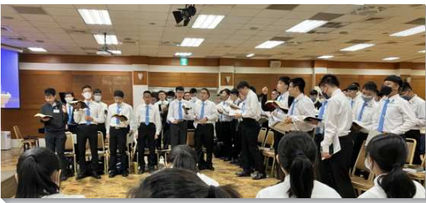
▲全臺高中一週訓練在高雄新盛會所舉行

訓練的每日從一聲聲呼求主名開始，學員們五點三十分起床呼求主名、個人晨興，操練將一天中最上好的時間分別歸主。課前釋放靈的禱告、同伴間喜樂洋溢的彼