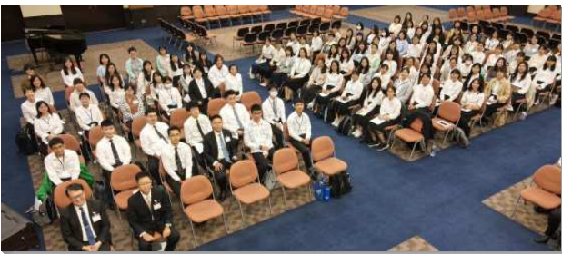
▲全台大學新生特會在中部相調中心舉行

新生特會信息的內容，是專特為著大一新生設計，其中包含靈的認識與操練、晨興及個人禱告，期望他們能在運用靈上有突破，過著與主親近、天天吸取主、並泡透在屬靈滋養之下的生活，因而在屬靈的生命上長進。