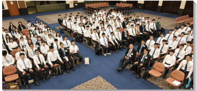
▲全台各校園大學新生參加特會

本次的特會中有兩個專題，分別為『如何讀書與選課』，以及『入住弟兄姊妹之家』。在大學任教的弟兄回應新生的提問，說到如何在大學生活中分配時間、如何在大學起頭就確定自己是否有交換出國的打算，並在讀書上增進興趣，也以主僕李常受弟兄的經歷來勉勵學生，盡自己的本分，天天讀書八小時並分別六小時在屬靈的事上，豫備自己，也培養好的性格，藉由交換和出國讀書的機會擴大自己，更能應付主在全地的需要。