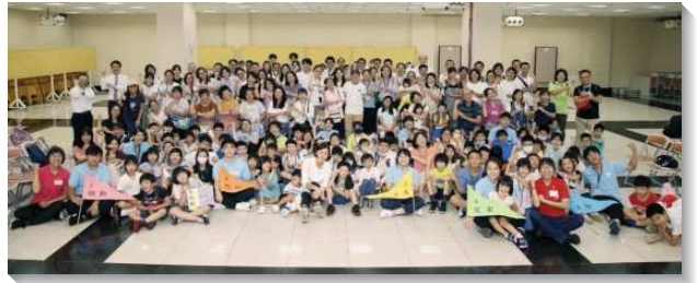
▲2023 年士林大區親子健康生活園

八月十二日在忠義會所，有一百四十六人有分團體的大地遊戲、家長交通以及兒童展覽。在大地遊戲中藉著具體的操作，讓家長和孩子們受題醒，要為尚未