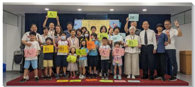
▲2023 年港湖大區親子健康生活園

在兒童排實行上，服事者不只在聚會中說故事引導孩子們認識『勤、大、細』的內在意義，並盼望與會的家長帶著自己的兒女操練，背誦『勤、大、細』的