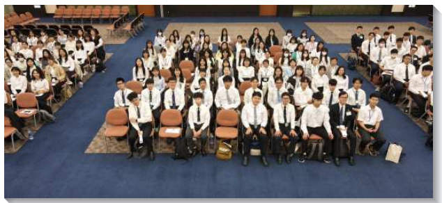
▲全台大學聖徒參加新生特會

『你要逃避青年人的私慾，同那清心呼求主的人，竭力追求公義、信、愛、和平。』這經節給我們看見，青年人逃避私慾以及追求基督具體的路，乃是在於同那清心呼求主的人，這要使我們蒙拯救，並能竭力追求基督。弟兄們末了也勉勵學生們，不要擔憂能否達到入住公約上的要求，而是需要將一項項的公約帶進禱告裏，使我們摸著一切規定背後的負擔，並成為和同伴一起竭力追求基督的青年人。