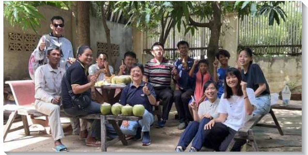
▲聖徒們至柬埔寨開展傳福音

第三，我們經歷放下自己老舊的觀念與意見，跟隨聖靈的帶領。藉著天天進入職事的話，我們看見使徒行傳中的安提阿召會就是召會得著擴展的事例。在安