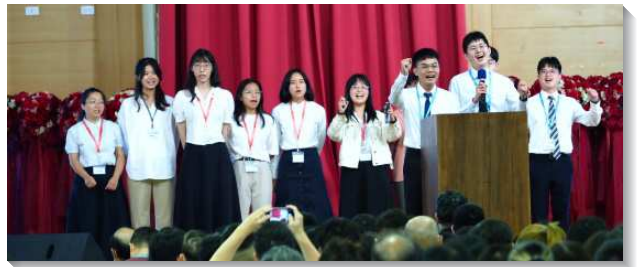
▲大學生見證與路加聖徒配搭校園福音

四、海外開展見證：使徒在那裏，路加就在那裏。歐洲及各地的開展，需要路加聖徒的代禱及關注。會中特別交通烏克蘭眾召會的現況與代禱事項，求主捆綁惡者，保守當地聖徒在動盪的局勢中都平安。