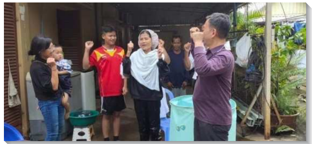
▲聖徒們在柬埔寨傳福音帶人得救

起初我們藉著叩門，得著了一些單個的新人，但隨後主更帶領我們往前，看見當地需要得著關鍵的家。弟兄姊妹都阿們這交通並也為此禁食禱告，在最後兩天，主不斷地將人加給我們。有位媽媽跑來洗衣店聽我們向人傳講，晚上就帶著兒女一同來受浸。有一位青年在接受主的事上遭受母親反對，但依然受浸得救