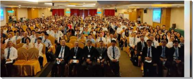
▲2023 年路加聖徒集調在嘉義舉行

本次集調總題是：『定準異象、跟隨榜樣、傳承託付』。信息非常豐富，乃是將今年夏季結晶讀經十二篇信息，再有簡要的複習與進入，使主恢復之中心負擔與現有真理成為路加聖徒定準的異象。弟兄們說，有異象不簡單，定準異象更不簡單。我們的異象應該是李弟兄九四年以後所看見的異象。跟隨榜樣，也不僅僅是跟隨