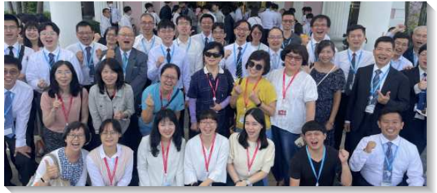
▲全台和海外路加聖徒參加集調

二、職場福音見證：各地在醫院都有職場活力排的聚集，彼此牧養，同在职場上發熱、發光。路加聖徒