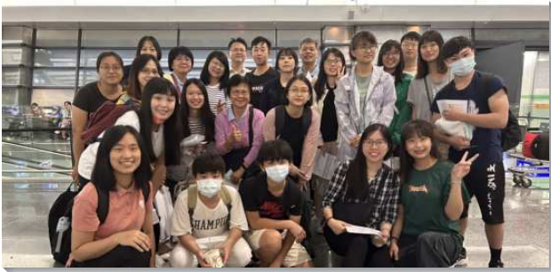
▲聖徒們赴柬埔寨開展

這次開展有三個主要的蒙恩。第一，我們經歷主的靈衝破一切的限制。因著有來自各國的聖徒們一同配搭開展，弟兄姊妹必須用英文禱告並交通。剛開始不同的語言使我們無法自由釋放我們的靈，然而藉著多而又多的