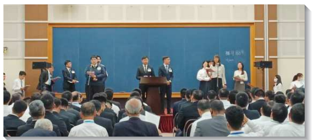
▲ 全時間聖徒在成全訓練中分享

事奉系列分三篇信息，第一篇信息是『我們必須實行活力排，好使召會得著擴增並建造』，活力排把我們帶入神兒女正常的光景中，我們該勞苦建立活力排的模型。我們需要率先為活力排的實行禱告並拼上一切。第二篇信息為『在事奉上主動、進取、並在身體的交通中盡功用』，尼希米和保羅是進取、開疆拓土的榜樣；遇到難成的事，要能說『我來，我作』。要有開路者的靈，遇山挖洞，遇河造橋。第三篇信息是『在主的行動中與祂是一，為著召會作耶穌見證的擴增與開展』，藉著同心合意，連同禱告、那靈、話與家經歷擴增；需要栽種召會樹，使作生命的三一神得著團體的彰顯。