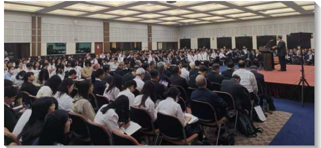
▲ 全合同工參加成全訓練

生命系列共三篇信息，第一篇信息是『否認己而作禱告的人，使召會成為禱告的殿，以完成神的經綸』。人第一次的罪是因向神獨立，需要經過禱告等候神、尋求神的旨意而投靠神，跟隨第一位神人的榜樣作一個禱告的人，召會成為禱告的殿。第二篇信息為『照著那在耶穌身上是實際者行事為人，豐富的享受並經歷基督』，四福音是『那在耶穌身上是實際者』的記載，也就是彰顯神之生活的記載，祂的生活所彰顯出來的都是實際，今天我們該照著那實際而行。我們要豐富的享受並經歷基督、活基督、就必須是在靈裏的人，成為如哥林多後書所說的俘虜、薦信、鏡子、瓦器、大使、同工、殿、