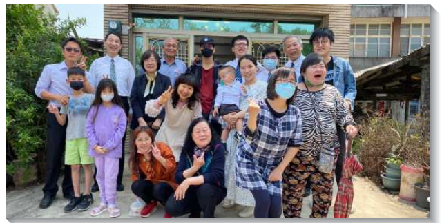
▲聖徒們至嘉義縣義竹鄉配搭傳福音

讚美主！馬太二十四章十四節說『這國度的福音要傳遍天下，對萬民作見證，然後末期纔來到。』國度的福音，包括恩典的福音（徒二十4），不僅把人帶進神的救恩，也把入帶進諸天的國。在這世代結束之前，國度的福音要傳遍整個居人之地，對萬民作見證。因此，這傳揚乃是這世代終結的兆頭。我們願與主同工傳揚福音，成為一班愛祂顯現的人。（姜鍾鈴）