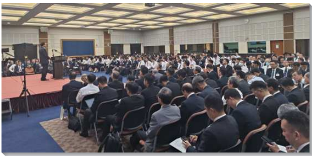
▲ 全台同工成全訓練在中部相調中心舉行

真理系列有二篇信息，第一篇信息是『為著被神新約的職事所構成，推動研讀生命讀經，並與主合作，教導高品真理』。李常受文集一九九三年第二冊說到，『…我們這樣用生命的角度來研讀聖經…；至終，我們的研讀就把我們帶到神經綸的啓示裏。』我們需要年日來進入新約的職事，研讀生命讀經，被這新約的職事所構成。並幫助我們所在地的聖徒，在個人和聚會這兩方面