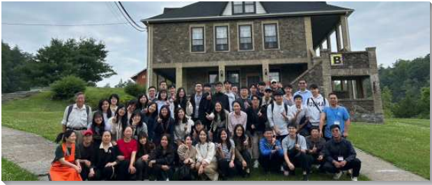
▲聖徒們訪問紐約昆努伊勒相調營地

此次訪問最可貴的是與美國幾處召會的聖徒相調，包含紐約召會、鳳凰城召會、坦佩召會、喜瑞都召會。行程第一週，我們走訪東西岸數個景點，其中召會產業—紐約Camp Rosendale (KPCC) 昆努伊勒（創三十二30）