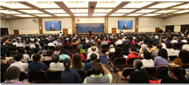
▲壯年班冬季畢業聚會在中部相調中心舉行

聚會開始先唱兩首詩歌：『一件美事』及『在今天更新奉獻』。接著有學員們的畢業見證，各個均令人感動。有學員定時禱告的蒙恩，有學員見證從原初不冷不熱的光景，恢復到對主起初的愛，而繼續奔跑賽程。也有學員原本懼怕申言，藉著申言訓練，積極操練成為召會中供應的節。有學員見證順服就是蒙福，操練順服在訓練中就享受主的祝福。還有夫婦一同參訓，見證壯年班的訓練使他們的家從虛空無奈，轉為福杯滿溢。