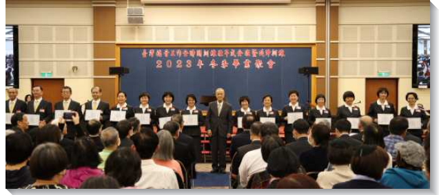
▲壯年班畢業學員們獲頒各項獎狀

兄姊妹。同時也盼望尚未參加過訓練的，於七十歲以前把握機會，因壯年班新的規定，年齡上限是七十歲。提後一章十三至十四節說到，『你從我聽的那健康話語的規範，要用基督耶穌裏的信和愛持守著。你要藉著那住在我們裏面的聖靈，保守那美好的託付。』保羅囑咐提摩太在當時召會敗落時，守住健康話語的規範，且是美好的託付。在提後二章二節說，『從我所聽見的，要託付那忠信、能教導別人的人。』這就是要代代的傳承。