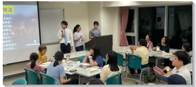
▲學生與聖徒們配搭校園福音講座

九月新生福音節期，社區聖徒與學生們一同配搭，進到宿舍接觸新生，邀約他們參加校園的社團聚集，以及會所的相調用餐。讚美主，藉著弟兄姊妹的代禱與配搭，邀約到許多新生來到會所，之後仍持續與我們接觸，且進到校園排與召會生活中。因著校園排人數繁增，地點也換到更大的教室。願主繼續得著這個校園的開展，將更多青年人加給祂的召會。（鄭易軒）