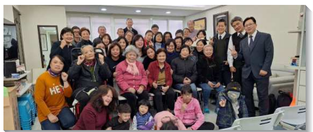
▲聖徒同心合意禱告行動增區成功

藉著天天同心合意的禱告後，每個活力組都滿了負擔，盡生機的功用，兩兩配搭在週間有活力的行動、探望關心人、與人用餐交通，並邀請人同過召會生活。藉著多方的相調與邀約，小排從原本的七人，繁增到二十三位，有三倍的繁增。四個主日也連續達到四十二、四十五、四十二、四十六人，我們實在能見證，聽見主的話就去實行的有福了。藉著列出名單、儆醒禱告就經歷『在人不能，在神凡事都能』，主把一個一個的人加給我們。增區以後，我們願意繼續操練實行，使更多的肢體盡功用，願主祝福祂在地上的行動。（劉仁恩）