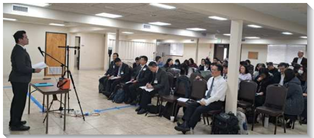
▲聖徒參加半年度冬季訓練禱研背講

息，由迦南美地所豫表』。為著能進入我們靈裏基督這安息日的安息，需要神活而有功效的話，刺入我們裏面，拯救我們脫離猶疑的心思和飄蕩的魂，好使我們現今能享受屬天的基督，將來能有分於國度的安息。第七篇是『認識升天』。我們需要看見主的升天客觀與主觀這兩方面，也要看見我們是在主的升天裏。在這升天裏，三一神在我們裏面行動，這行動成了我們的歷史。第八篇說到『經歷並享受包羅萬有的基督—我們在那地一無所缺』。這篇的負擔強調基督是豐富的土壤，我們需要忘掉我們的環境、光景、失敗及軟弱，單單花時間吸取主；當我們花時間吸取祂，就以神的增長而長大，為著建造基督的身體。第九篇說到『那地有石榴樹』。石榴表徵生命的豐滿、豐盛和美麗。我們若在生命上長大成熟，就要成為石榴。