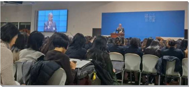
▲十二月半年度冬季訓練在美國加州安那翰舉行

在訓練中，弟兄們題到這次的訓練是戰略性的、也是關鍵性的。六十一年前，即一九六二年十二月，主的僕人李常受弟兄在美國開工的第一次特會，用申命記八章七至九節，開啓美地作為包羅萬有之基督的豫表。那次的特會成了主恢復中的一個里程碑，也是主在地上行動的轉捩點。現在，仇敵與牠邪惡的權勢仍然將基督的包羅萬有向神的子民遮蔽起來，因此這次的訓練也該成為我們的轉捩點，使我們再看見異象，能向主認真，天天得著這樣一位包羅萬有的基督。