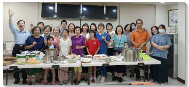
▲ 聖徒們同心服事得榮少年及家庭

在青少年服事部分，本會所於去年上半年開始服事得榮少年，這是主為我們打開福音的門。藉著得榮少年專案，我們很快在社區裏找到向福音、向召會敞開的家