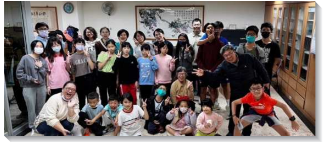
▲ 聖徒們喜樂配搭兒童排

在兒童幼幼排方面，固定聚會的兒童有六位，課程以性格三十點為基礎，配上合適的經節、詩歌、故事