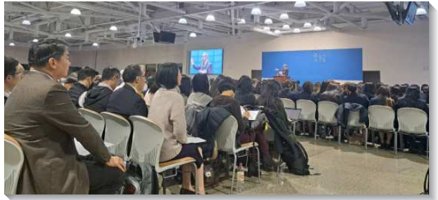
▲全球聖徒參加十二月半年度冬季訓練

第三篇至第九篇，看見美地的豐富包含我們對美地該有的認識與經歷。第三篇說到『那地有小麥與大麥』，第四篇說到『包羅萬有的基督作美地—那地有川，有泉，有源，從谷中和山上流出水來』，第五篇說到『那地有葡萄樹』，第六篇說到『基督作我們安息日的安