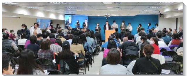
▲聖徒們一同有分冬季現場訓練

那地雖有亞納人，卻有基督追測不盡的豐富，有小麥和大麥，有水從谷中和山上流出來，還有葡萄樹所豫表