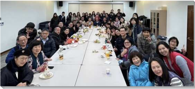
▲聖徒們享受活力生活成全

第七期的活力生活成全於去年底結束，第八期訓練於今年開始。在休訓期間的一月至二月間，文山一大