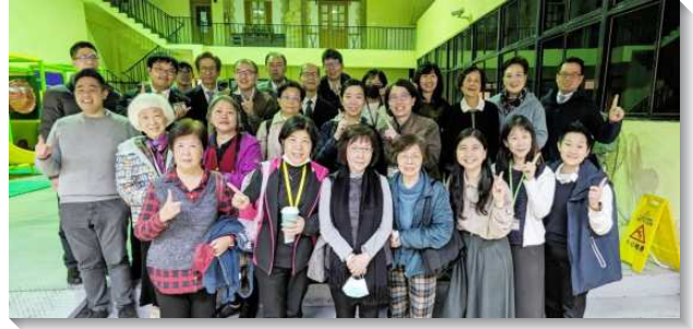
▲聖徒在冬季現場訓練中享受神的說話

上次增多，有更多的聖徒在聚集中享受神的說話。在事務服事的配搭上，各會所的聯絡人彼此多有交通，盼望能帶進更多的聖徒一同事奉配搭，藉這樣的機會也能有分於聚集。各會所輪流上台展覽時，許多會所都是青年人上台分享，令人喜樂！看見青年人在年輕的時候寶愛真理享受神的說話，實在是有福。