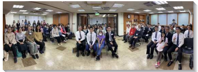
▲聖徒在召會生活中一同往前

另有姊妹分享，因對李常受文集堅定持續的追求，不斷從信息中領受豐富，在職場上雖經歷低谷，但心情上仍能平靜不受影響，藉著享受主，經歷主作安息。更有學生聖徒分享，弟兄姊妹顧到研究生課業忙碌，常透過