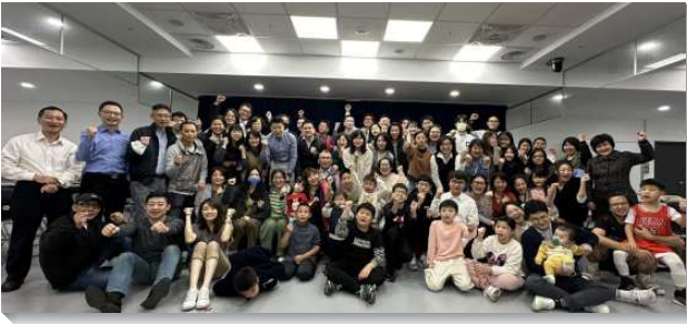
▲聖徒們參加數算主恩相調聚會

有多位姊妹見證，在這一年，青春期的孩子受浸得救，從社區進入青少年區聚會，在屬靈上得著進一步的餵養，也開始操練在聚會中申言，並學習在各樣服事上盡功用。這些甫於暑假受浸得救的青少年聖徒見證，進入學生區之後有了更多的操練，不再覺得傳福