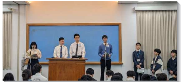
▲大學聖徒在冬季現場訓練中分享

在第八篇信息『經歷並享受包羅萬有的基督作美地——我們在那地一無所缺』，啓示基督作為我們在其中一無所缺的美地，乃是豐富的土壤，我們已在其中生根，好使我們從這土壤吸收元素而長大。歌羅西書二章告訴我們基督作為美地是何等的豐富，今天我們需要花更多時間吸取主，使我們以神的增長而長大。學生們也回應，羨慕能過扎根於主的生活，對於基督的經歷需要更擴大。願意在一年的起頭，操練個人禱告親近主，扎根在主裏。如同耶利米書十七章八節所說，像樹栽於水旁，沿河邊扎根，炎熱來到也不懼怕。