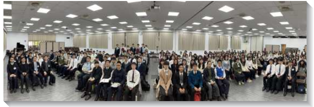
▲大學聖徒參加冬季現場訓練

接續這個負擔，本次專題交通，請七位全時間配搭服事的弟兄們上台作見證，向學生們分享他們如何經歷這位犧牲的基督，好使學生們也能為人犧牲。聚會首先唱補充本詩歌四百六十八首一奠祭，將學生們都帶進奉獻的負擔。弟兄們分享個人與主情深的經歷，都是平常不會向學生們提及的。有弟兄說到願意為主