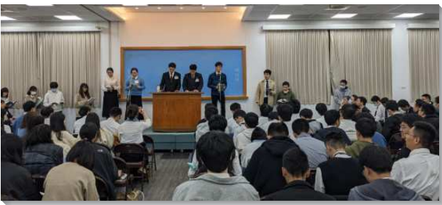
▲大學聖徒冬季現場訓練在三會所舉行

本次訓練的主題是『經營美地所豫表包羅萬有的基督，為著建造召會作基督的身體，為著國度的實際與實現，並為著新婦得以為主的來臨將自己豫備好』。訓練開頭弟兄們鼓勵我們需要坐在主腳前聽祂說話。有四個要點：向主敞開、在謙卑的地位上、安靜的坐著並接受主生命的活話。我們藉著聽主說話，就接受祂的重新訓練，使我們成為新的一代，能承受美地的人。