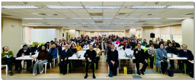
▲得榮基金會志工成長活動

關懷者分享會中，一位媽媽分享，女兒在上完八次生命教育課程後有很大的改變。原本女兒經常與她爭