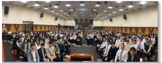
▲文山二、三大區大學、青少年寒假特會

第三篇信息著重交通『復興是一個律，不是一個工作』。我們不需要一時的奮興，而是需要晨晨復興。復興需要每天呼吸、喫喝，並藉著傳福音結果子、愛主並餵養主的小羊、在召會生活裏有確定的服事和配搭，有