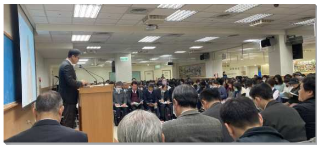
▲文山一大區冬季現場訓練

哥林多前書十一章二十六節說，『你們每逢喫這餅，喝這杯，是宣告主的死，直等到祂來』。主日聚會是主自己親自設立的，為著豫備主的回來，我們需要看重主日聚會，在主日聚會中一同來記念主。弟兄姊妹在分享中也回應這負擔，不僅為身邊的弟兄姊妹禱告，眾人一同進到美地爭戰，也需要在生活中彼此供應，與同伴早