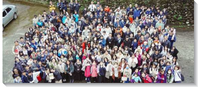
▲港湖暨文山一大區青少年寒假特會

弟兄們也接受職事的負擔，尋求用經歷的方式帶領青年人進入真理，並擺上自己經歷主的見證，期能摸著孩子們的心，帶進他們對追求生命長大的渴慕。