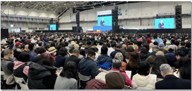
▲二〇二四年國際華語相調特會在台北舉行

本次特會總題為：『打美好的仗、跑盡賽程、守住信仰，並愛主的顯現，好得著基督作公義冠冕的賞賜。』藉由弟兄們釋放五篇信息以及各國弟兄們的分享，勉勵聖徒：持定經過過程並終極完成的三一神作生命，打美好的仗，望斷以及於耶穌，過正常的基督徒生活，奔跑賽程，以照神永遠的定旨完成神的經綸，直到路終。此