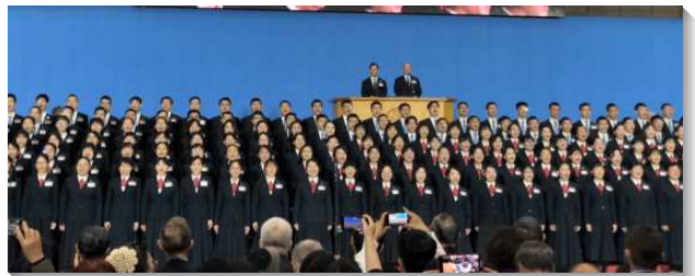
▲二百位全時間訓練學員展覽詩歌

擘餅聚會後，介紹各國參加的代表，由距離最遠的美洲、非洲、歐洲及亞洲，以英文字母開頭為順序一一唱名介紹本次一同赴會的七十八個國家。當不同膚色、種族的聖徒步向台前時，弟兄姊妹們無不喜樂歡騰。其中，中南美洲的聖徒們搭了三十六小時的飛機來台灣。