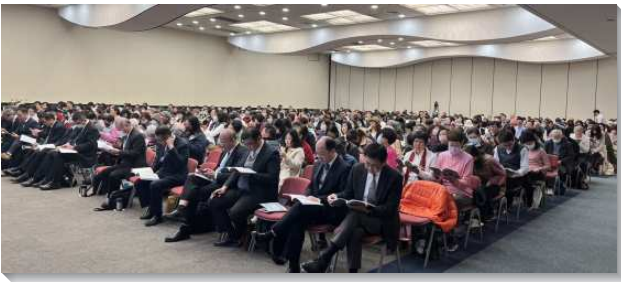
▲ 聖徒們參加信基大區冬季現場訓練

我們若要據有美地以成就神的定旨，就必須從事屬靈的爭戰，擊敗撒但的勢力。基督是我們的美地，神