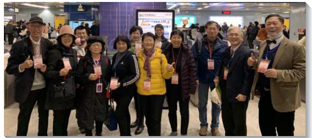
▲ 聖徒喜樂熱切接待海外聖徒

兩天特會節期，來自七十八個國家約三萬多聖徒欣喜且井然有序赴會，如詩篇所說『人對我說，我們往耶和華的殿去，我就歡喜。』滿有過節相調的實際。