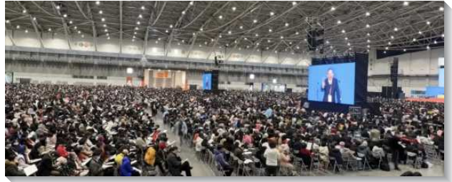
▲海內外聖徒參加二〇二四年國際華語相調特會

海外開展的展覽中，邀請現今以及曾赴海外開展的聖徒們一同上台同唱詩歌『一件美事』，歌詞見證他們在世界各地，澆在主身上的不是枉費，乃是馨香的見證。