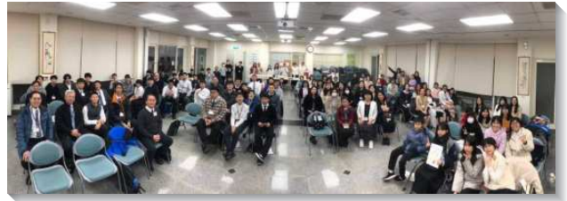
▲士林大區高國中寒假特會

這三篇信息幫助青少年認識要成為一位合乎神心的君王，該有怎樣的生命。末了一篇從大衛殺害烏利亞的犯罪和悔改的事例中，看見大衛的悔改雖然已蒙神赦免，但神行政的對付沒有離開大衛家。這非常題醒青少年需要省察自己的心，並逃避青年人的私慾。