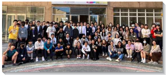
▲信基大區中學生寒假特會

第二篇信息，說到模成與得榮，模成乃是模成神長子的形像，模成神長子的形像，就是信徒在作神人的生命上完全長成，這就是作神人基督的翻版，與祂這位作神長子的，畢像畢肖。得榮就是信徒在基督的生