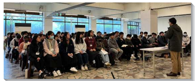
▲大安、城中、中山大同青少年寒假特會

他們在年少時如何摸著主並欣然起來愛主、追求主。大哥哥姊姊們的見證激勵青少年們也渴慕經歷基督。