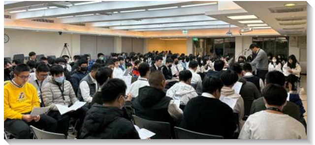
▲北投大區青少年寒假特會

本次特會也邀請許多在北投各會所的聖徒及宜蘭的聖徒作見證，見證內容契合特會的主題，也相當豐富多