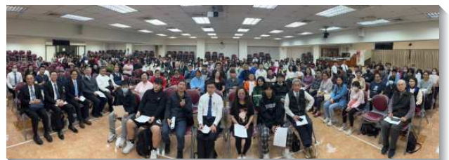
▲得榮基金會頒發得榮少年證書暨福音聚會

服事的弟兄們，分享個人以及全家對主的經歷，如親子關係、召會生活，以及青少年現今所面臨的潮流等，對家長和得少都相當有幫助。弟兄們藉此鼓勵得少們，