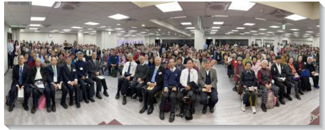
▲生命成全照顧組聖徒至永和新會所相調

相調聚會開始，聖徒們享受詩歌：經歷基督作一切，我們已得到宇宙至寶，眾人心裏歡呼何等一位基督給我們得到。接著弟兄交通，聖徒們的肉身年齡可能年長，但靈不應老舊，這需要生命的成全與照顧。因此，每一天清早開始就需要藉著晨興享受主，未見人面前先見神面，親近神，與神有交通。使用晨興聖言材料，禱讀每天的聖經節，摸著主話的豐富與實際。運用禱讀的祕訣，直讀主的話，話讀主的話（主觀的讀），話禱主話（藉著主的話向主禱告）。藉此一早就泡透在主的話裏，活在主話的光中，帶領我們一天的生活。