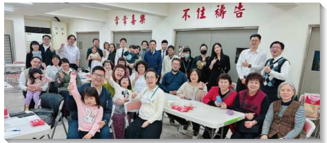
▲聖徒積極過召會生活

體禱告聚會、實體小排聚集、組組週間外出探訪人，實行家聚會、活力排，盼望人人緊起來打仗、動起來奔跑，傳福音得人，得著建造的材料。實行牧養，使果子常存。成全人，才有建造的配搭，人人都渴望向上去得獎賞。為恢復中幹聖徒的活力，鼓勵聖徒參加生命讀經共同追求、週中成全聚會（每週一次），以及每個月一次的弟兄及姊妹成全聚會、在職成全聚會，願人人都成為主的門徒，而非只是跟隨的群眾。