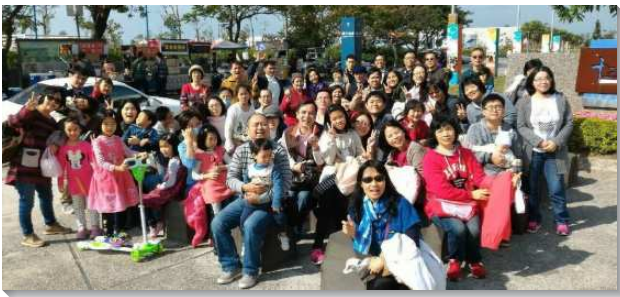
▲聖徒們緊緊跟隨召會的水流往前

漸減，然而藉由幾位姊妹天天不間斷為召會及負責弟兄禱告，在一次聚會中，幾位負責弟兄聽見十會所實行週週出外探訪聖徒家，深受激勵，亦相約開始實行探訪及愛筵各小區負責弟兄家，並天天線上為人代禱。各小區也實行天天有事奉核心的聖徒一同禱告，環環聯結，全會所滿有同心合意的光景。