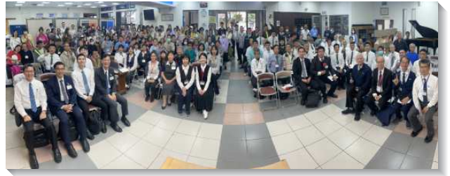
▲ 全台手語聖徒相調特會在花蓮市召會舉行

會生活的近況及蒙恩。雖然聽障聖徒外在情況受許多的限制，但藉著基督身體的相調與交通，眾人同得鼓勵，與同伴憑著忍耐一同奔那擺在我們前面的賽程。