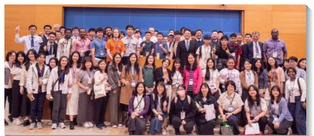
▲ 全台大學外語生相調聚會在台中市召會舉行

聚會開頭，來自不同國家的外語學生藉著詩歌相調在一起，學生們歡唱『我們在召會這方舟裏』，脫離一切屬地的口味向著主的呼召敞開。他們分享因著主話語的解開而歡樂，看見主今天是土壤，我們能藉著禱告自由的向祂說話，且吸取這豐富土壤的一切元素。有學生在