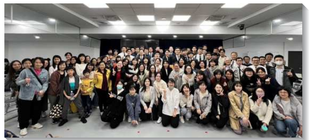
▲學生們參加青少年暨大專寒假特會

在青少年服事者事奉相調聚會裏，交通如何得著青少年—神永遠經綸的尊貴器皿，並盼望成全一班青少年服事者作群羊的榜樣，用話和靈帶領少年人。除了青少年服事者，會所的高三生們更是得加強，堅定他們服事人的心志，奉獻大學生活，作區裏年幼聖徒們的榜樣。