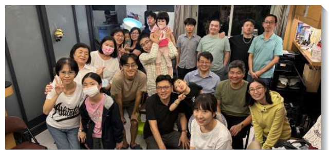
▲聖徒們喜樂配搭兒童福音排

展望會所擴增開展的前景，我們特別留意本會所範圍內六張犁AB基地有公共住宅七百餘戶，三興段社會公共住宅五百六十戶，將分別於今年、明年落成，屆時可迎進約六千位青年人入住，是傳福音得青年人的大魚場。現正積極尋求聚會場地，作為照顧、牧養新人，承裝主祝福的器皿。願主祝福。（張正中）