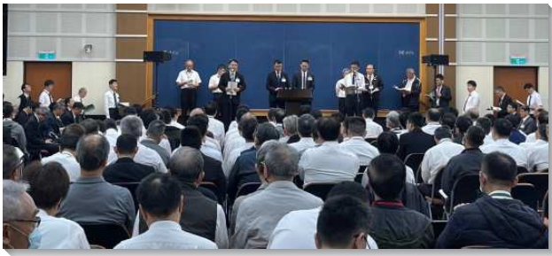
▲全台弟兄事奉集調在中部相調中心舉行

聖經中三提書是很特別的，提摩太前書的主題是『神對召會的經綸』，提摩太後書的主題是『對召會敗落的豫防劑』，提多書的主題是『召會秩序的維持』。提後是保羅在離世之前對召會末了的話。這次訓練幫助我們從一個特別的角度來看提後，這總題包