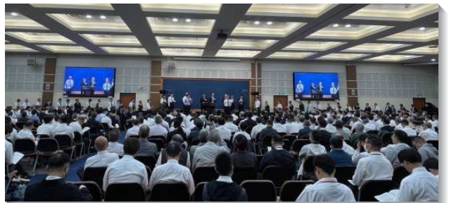
▲弟兄們在事奉集調中分享

信息給我們很大的題醒，神救我們並呼召我們是要完成祂的定旨。而祂永遠的定旨是要將祂自己分賜到祂所揀選並救贖的人裏面，使他們在生命和性情上與祂一式一樣，只是無分於神格，使祂得著擴大並擴展的彰顯。