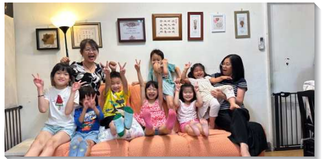
▲聖徒們積極開家服事兒童排

因著少子化，兒童排人數遲遲無法繁增，我們有強烈的危機感，藉著此次相調的交通與分享後，大大的鼓勵並加強我們。我們不只要作召會中的兒童，更要做外邦的兒童，看見兒童是大的福音！盼望在兒童排中，主的話能進到兒童的生活裏，學習有禱告，從小愛神敬畏神，自然而然的活出品格。也讓孩子們常有喜樂的心，將喜樂傳給周圍的人，成為福音的小尖兵。（劉心茹）