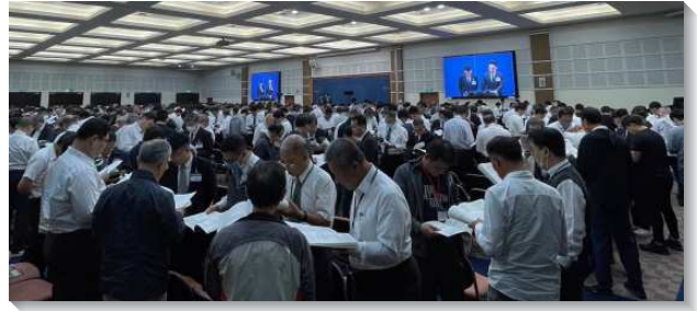
▲全台弟兄們在事奉集調中分組讀信息

此次弟兄集調交通到關於提後這卷書信的要點，帶我們用神經綸的眼光來看召會敗落，看器皿的光景，鼓勵