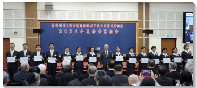
▲畢業學員獲頒畢業證書及各種獎項

弟兄題醒畢業的學員勿因久住而衰微，乃要更新奉獻，參與當地開展和鄉鎮移民開展，傳揚國度福音，有分於短期海外開展，投身於主在全地的行動裏！