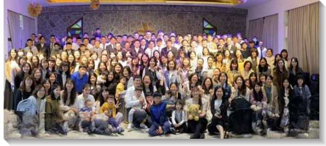
▲大安區青職聖徒參加特會

在真理上，我們需要認識召會是真理的柱石和根基，今天我們在一個絕佳的機會能被真理構成，就是週週進入生命讀經和恢復本聖經，使我們藉著研讀主話中的真理，得著正確的屬靈教育，不僅如此，弟兄們也以自身為例，說明如何在小排中把每篇生命讀經