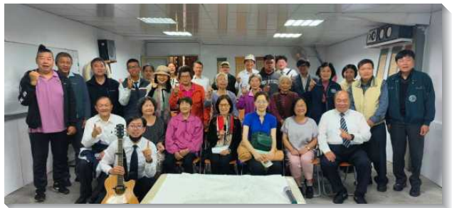
▲聖徒們積極過召會生活

另外，本會所亦配合文山三大區一同開展鄉鎮召會，地點是新竹縣峨眉鄉。該地區居民有百分之九十五是客家人，民風純樸，但相對保守。經過聖徒們兩年多來同心合意的配搭開展，從原先只有兩位聖徒，目前已繁殖擴增至每週主日平均有十五位聖徒及福音朋友到會。峨眉鄉召會預計於今年十一月上旬將正式成立，使金燈台能在該地區發光照耀。感謝主，願主大大祝福祂的召會，榮耀歸給神。（葉增勇）