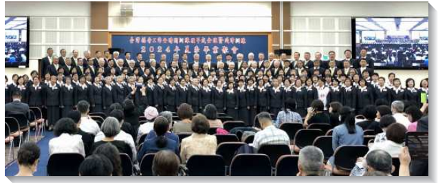
▲壯年班暨延伸訓練畢業學員展覽詩歌

榮耀感人的蒙恩見證印證壯年班是個奇妙的生命園子，使年長者因心思更新變年輕，年輕者因習練通達變老練！小學沒畢業的弟兄受主吸引，在一年內完成新舊約讀經一遍，及十本屬靈書報的閱讀和心得報告，獲得書卷獎！或鬆散隨性的個人生活，或常有火花的家庭生