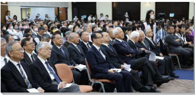
▲聖徒們參加壯年班暨延伸訓練夏季畢業聚會

一位姊妹見證，因著癌末被主尋回，抗癌期間經歷八十三次的化療和十二次大小手術。那時她向主禱告，如果還有未來要參加壯年班。如今她完全得醫治，她在壯年班受成全，將每天當作是生命中的最後一天，竭力奔