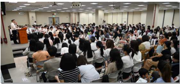
▲聖徒們參加在職成全聚會

頭兩堂信息幫助我們認清職業的本質和召會生活的價值。弟兄們引用神呼召摩西盡職前的一個神蹟：『杖就變作蛇…耶和華對摩西說，伸出手來，抓住蛇的尾巴…蛇就在他手掌中變作杖。』（出四3-4）這說出職業原本像杖是謀生的工具，竟成為撒但藏身之處，霸佔人。基督徒必須懂得從『尾巴』拿起，不用世俗的方式對待掌握它：世人擁有職業都是為自己，而基督徒的職業應該先為著主，並使職業能為主所用。有人常問該如何在