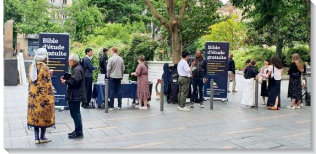
▲全球聖徒到法國配搭發送聖經傳福音

自五月六日起，來自世界各地的聖徒聚集在法國，沿著奧運聖火傳遞的路線發送法語和英語的《新約聖經恢復本》及其他信息材料。每個梯次都是五天的時