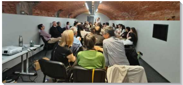
▲聖徒邀人參加研討會傳揚真理

間，聖徒們於第一天抵達，第五天離開，只有三天的時間傳揚福音，時間短暫。但是所到之地都令我們非常驚奇，我們所接觸到的人反應都非常敞開。我們提供他們訊息，以認識我們是誰，認識主的恢復，也提供我們的行程表、研討會的時間。許多敞開者和我們加好友，以確定彼此再聯繫。很多青年人主動的來索取聖經，有人說這段時間心裏突然有福音的需要，想要讀聖經。有人想尋求人生的意義，就遇見了我們。感謝主已經豫備好人的心。福音行動已在法國九個城市展開：馬賽、蒙彼利埃、圖盧茲、波爾多、卡昂、雷恩、南特、斯特拉斯堡、里爾。聖徒們分送了數千本聖經，也接觸數百人認識基督。聖靈也在弟兄姊妹裏面動工，看到這麼多人向主敞開，覺得是不是要與神配合，移民到當地。