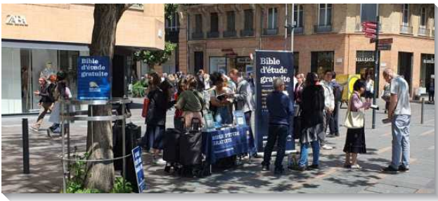
▲聖徒分梯次到法國各地發送聖經接觸人

為著此次福音行動的開展，在歐洲的弟兄們尋求交通並禱告，參考已過的福音行動，從二〇一二年在倫敦舉行的奧運，二〇一六年在德國的援助難民行動，以及二〇二二年援助烏克蘭難民的福音行動，覺得這次不只是大量的發送聖經，更要留下敞開者的名單，以及後續的牧養照顧，並且要在當地興起教會。