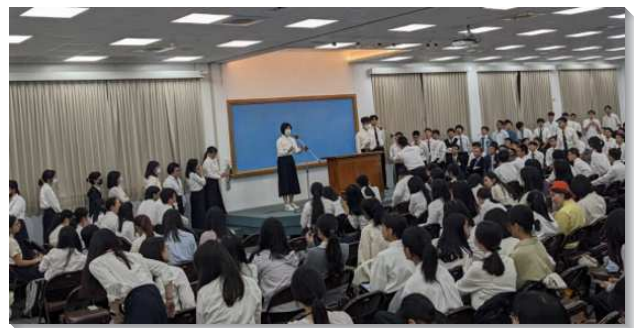
▲大學聖徒在現場訓練中得主加強

最後在第十二篇信息『神聖的三一、耶穌的靈與神的國』，弟兄們提到，復活基督的繁殖，召會的擴增和神國的開展是一件出代價的事情。這不在於外面的恩賜或口才，而是在於使徒行傳六章四節，有一班人說『我們