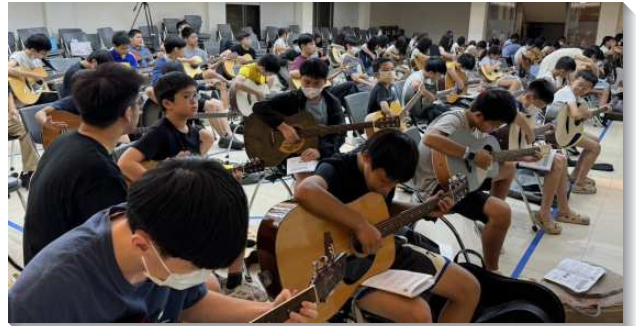
▲青少年參加豐富的暑假活動

除了週間的暑假活動，服事者們亦根據小羊的需要，有個別的家聚會，不只邀約小羊來，也出訪看望小羊。盼望經過兩個月的暑假，學生們有更多的機會受成全、被裝備，讓主得著他們全人！（黃梓昀）