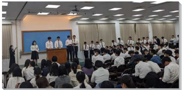
▲大學聖徒於現場訓練中踴躍分享

接續這個負擔，本次訓練的專題交通說到校園工作的急迫性，弟兄們囑咐我們要成為復活基督的見證人，被構成為門徒，並且在校園中產生複製，就是產生屬靈的下一代，使更多的學生成為門徒。在這場聚會中，有十二位學生和兩位全時間服事者作見證，說到他們如何因著看見校園的光景，並從主領受負擔，為著主在他們校園裏面的見證而奉獻自己。其中儘管