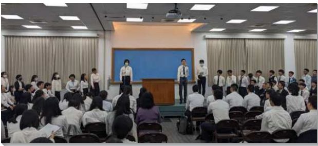
▲大學聖徒夏季現場訓練在三會所舉行

本次訓練的主題是『經歷、享受並彰顯基督（一）』，這乃是神聖啓示的心臟，也是神新約經綸的中心思想。訓練開頭弟兄們鼓勵我們需要操練我們的靈，因為要經歷基督乃是在我們的靈裏。並且我們不但要經歷，更要享受基督，而享受祂乃是在魂裏的事，所以弟兄引用腓立比書二章二節鼓勵我們要在魂裏連結，思念同一件事，就是要對基督有主觀的認識和經歷。