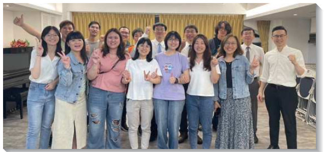
▲聖徒們過有活力的生活

經過這半年堅定持續的推動活力組，原先無力的弟兄姊妹，脫離老舊的光景，一面也被調整，越能與同伴配搭，不再單顧自己的事或留在個人的感覺裏，而是先為著主的需要擺上，就越進而顯出福音的能力。我們真是見證，實行神所命定的路，就引進生命的水流，使召會生活滿了活力，結出新果！（葉恩揚）