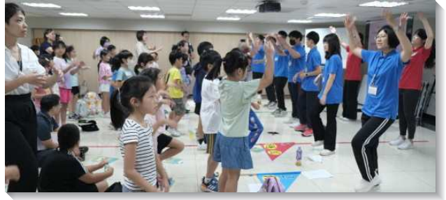
▲中山大同區親子健康生活園

小五、六的孩子將邁入青少年，對於唱唱跳跳不再那麼投入，本次以青少年聚會的方式，帶他們享受詩歌，彼此對說。故事也用重點提示的方式，並留時間讓他們輪流讀榜樣人物—但以理的性格特點，也讓他們有專屬的空間，安靜的完成勞作。這樣的分班改善了以往幼童到了下午會因為太疲累，而影響隊伍中其他孩子活動的進行。也讓高年級的兒童在下午回到隊伍中進行闖關遊