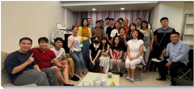
▲聖徒們天天追求生命讀經

經過交通後，我們實行上特別著重兩個點：第一，要共同追求；第二，要天天追求。聖徒們透過通訊軟體的群組通話。每天晚上十點，我們就共同在線上追求，也藉著彼此提醒、邀約，吸引更多的弟兄姊妹上