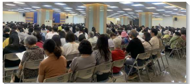
▲文山一大區夏季現場訓練

在訓練中，弟兄們將所領受的話，傳輸、供應給眾聖徒，幫助眾人抓住其中的要點，並正確領受主今時代的說話。第八篇信息中說到『賜生命的靈乃是終極完成的那靈，也就是經過過程並終極完成的三一神。』這樣的發表是新語言，神的靈從起初就有了，然而當我們說到賜生命的靈，就是神如何經過過程並終極完成。約翰福