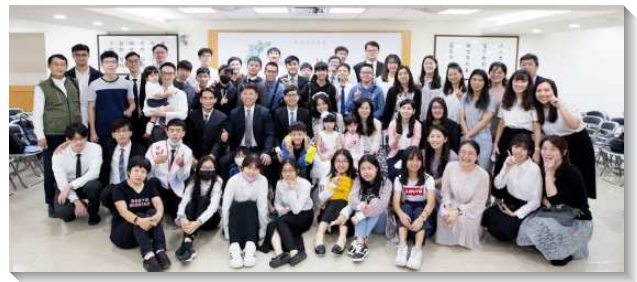
▲聖徒過以得人為導向的召會生活

經過八個月的實行，眾聖徒對福音逐漸有了負擔，陸續帶親友得救，其中一位八十歲弟兄也盡功用，帶一位鄰居是三十多歲的青年得救。第一季主日聚會人數自基數七十九位增加至平均八十七位，繁增率約百