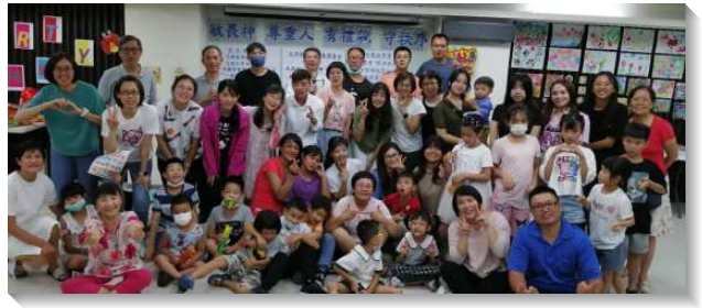
▲聖徒們一同配搭兒童暑期行動

這次暑期活動，出動老中青三代聖徒及福音家長當每堂課的指導老師。活動精彩豐富，有靈活專注的體適能和磁力運用，晶亮杯墊、摺紙藝術、會動的啄木鳥、冰涼汽泡飲、愛心卡片、水果奶酪、氣球蓋印藝術畫、豐年祭、仲夏之荷畫畫、盆栽蛋糕、多肉植物、愛的相框製作、沙畫、糖葫蘆、沙拉和麵疙瘩等各類活動。還有弟兄教導吉他烏克麗麗彈唱。聖徒就其生活領域、職場專長，設計各項專業技能，帶同報名參加的孩童和家長，動手動腦、動口動腳、有吃有喝、有唱有跳，無論