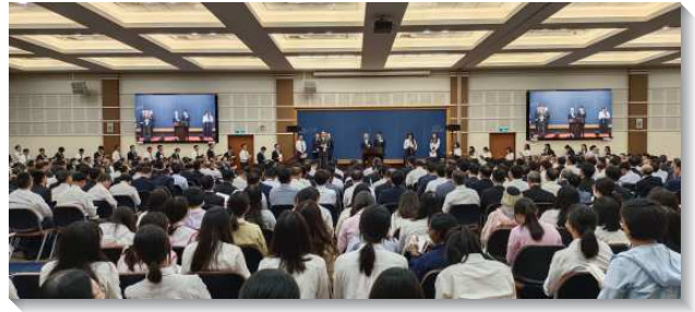
▲ 全合同工們於成全訓練中分享

生命系列有兩篇信息，第一篇說到『不依靠肉體，只憑靈事奉』，事奉主者必須認識甚麼是肉體，不僅是粗