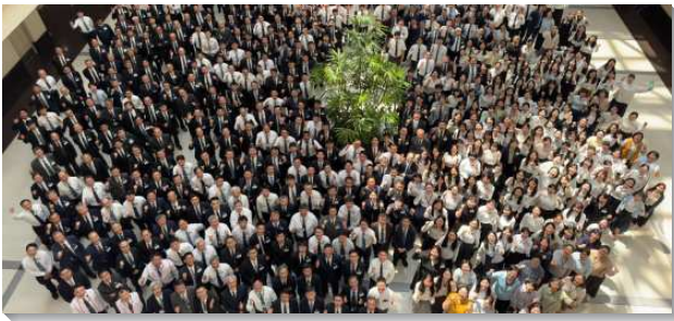
▲ 全合同工成全訓練在中部相調中心舉行

真理系列有三篇信息，第一篇說到『主的恢復乃是生命與一的見證』，主的恢復乃是生命與一的見證，失去生命與一就是失去主的見證。啓示錄裏用五個象徵來表徵召會：燈臺，男孩子，莊稼同初熟的果子，新婦（就是羔羊的妻），以及聖城新耶路撒冷。這五個象徵乃是扎實且清楚的異象，說明召會的所是、所應該是、所應該作的，以及主恢復的所是。以弗所書四章啓示一的兩方面：三節說到那靈的一，十三節說到信仰上並對神兒子之完全認識上的一，一的這兩方面是兩端；我們需要保守起頭的方面，使我們達到未了的方面。