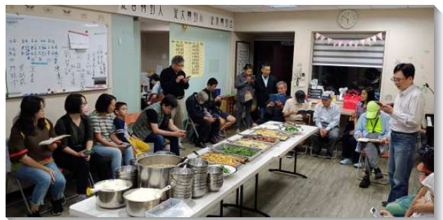
▲聖徒邀請人至會所相調用飯交通

弟兄豫備適合的信息，藉著互相的分享，彼此供應基督。每次約有五、六位青職或新人參加，加上服事者達十多位。一樓則是為著早上無法參加聚會的弟兄姊妹，聚會方式也以享受詩歌配上本週晨興聖言信息，以加深對主的享受。藉著這樣的實行，每週有八至十多位新人，以及青職聖徒，被牧養在召會生活中。感謝主！截至今年八月底已經受浸了三十二位新人，其中有幾位是兒童家長，他們都持續被牧養中。