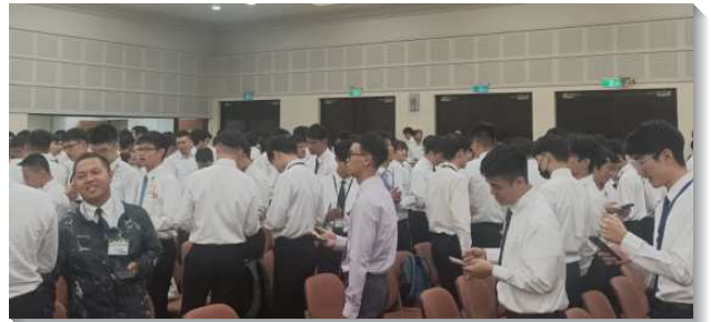
▲全台大學生參加期初特會

第五篇是『職事的擴大與國度的建立』，說到要走遍我們所在的地方，就會看見群眾並對他們動慈心，而為他們祈求，收割主的莊稼。我們要在地上為神的