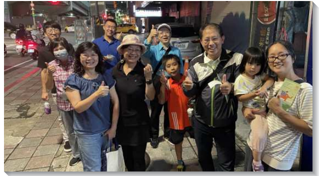
▲聖徒們喜樂出外傳福音

聖徒們外出接觸人，原本是四人一組，但有年輕的聖徒對接觸人感到膽怯，不敢開口。我們就調整為在兩個定點一起唱詩歌並接觸人。這樣傳福音很有士氣，眾人歡唱詩歌，有人經過，我們就發福音單張或對人傳講，團體傳福音使老少聖徒都能盡功用。幾週下來，過往路人已認出我們是基督徒，從原先不接受單張，到後來對