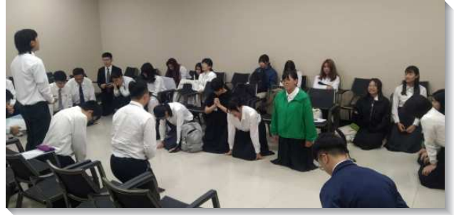
▲全台大學生為著期初特會禱告

第三篇是『王職事的開始與國度子民的性質、影響與生活』，說到新王那為著諸天之國的職事，乃是憑屬天的大光開始，我們必須在正確的位置，好在光的照耀下，為著諸天之國來跟隨新王。關於國度子民的性質，第一說到靈裏貧窮，不是指謙卑，更是指我們的靈，我們人的深處，完全倒空，不持守舊時代的老東西，卻要卸去舊有的，以接受諸天之國的新東西。我們若有國度子民的性質，對世界就有影響力，作鹽、作光。並且要過一種遠高於舊律法標準的生活，不只是對付外面的行為，更是對付裏面的動機，國度新律法更高的要求，只