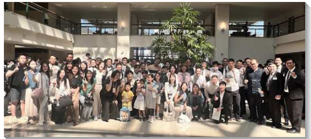
▲ 聖徒們踴躍參加青職特會

此外，特會信息指出，基督徒的生活應當是福音的生活，這不僅是主給每一個人的託付，也是召會在地上團體的見證。許多青職們宣告，願意繼續實行週週外出訪人傳福音，帶領更多人得救，並在生活中牧養人。另外特會中的職場座談，也讓青職們得著許多身體的供應。弟兄提到在職場中，我們不應因環境起伏而影響自己，反而要有屬靈的眼光，像約瑟一樣，看見所有環境都是神的祝福，並在職場上為主作剛強的見證。