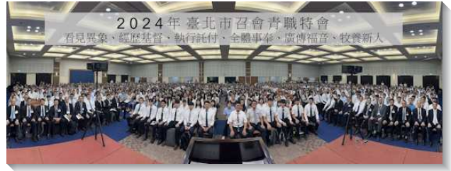
▲ 北市各會所聖徒參加青職特會

基督並顯大基督』，弟兄們引用行傳第九章保羅的經歷。主耶穌親自向保羅顯現，然而保羅仍需要進入團體的召會生活，藉著其他肢體的帶領與身體聯結。這點使青職們更加認識必須活在基督身體相調的實際，並放下個人主義，藉著彼此配搭，才能實行真正的身體生活。