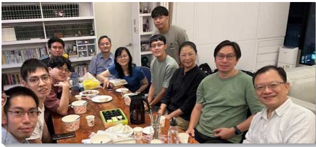
▲聖徒們共同追求生命讀經

為著開始操練，有位負責弟兄每日下午一時十五分，在群組上個別聯絡六十位弟兄姊妹，題醒聖徒設定鬧鐘