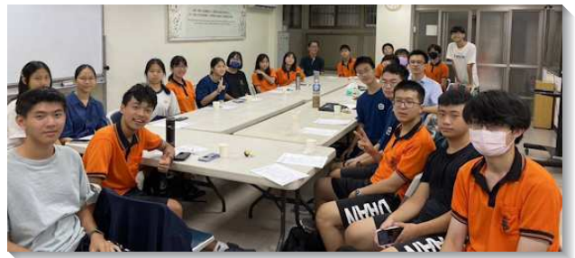
▲學生們實行校園活力排

本會所鄰近多所高中校園，有師大附中、大安高工、延平中學以及開平餐飲。多年來一直在高中校園福音上積極投入，近年考上的新生雖不多，但藉聖徒們忠信、堅定持續於放學後接觸學生，並認真經營校園排，目前週週穩定約二十位學生，其中近半為福音同學。這學期聖徒們更與學生們實行活力排，每週兩天於上學前至會所一同晨興享受主話，大家的靈被點活，對主有摸著、享受，學生弟兄姊妹們就產生出對福音的負擔和託付，自動自發的於每週一中午在校內一同為同學題名禱告，並積極邀約同學參加校園排，因此小排滿了新面孔及穩定參加的福音朋友，聚集很有味道且喜樂，神的話在校園中擴長起來。