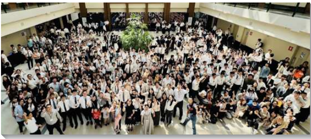
▲ 北市青職特會在中部相調中心舉行

特會的負擔在於加強青職聖徒承接主恢復的託付，不該僅停留在個人屬靈追求，而是進入團體的召會生活，活基督並顯大基督，實行身體生活，為著基督身體的建造。這次特會的供應不僅讓青職們看見異象，更幫助青職聖徒應用在家庭生活及職場生活中。弟兄們指出，主的託付如同『deposit』（存款），我們需要儲存主的話語，才能在靈命上有豐富的儲存和供應。