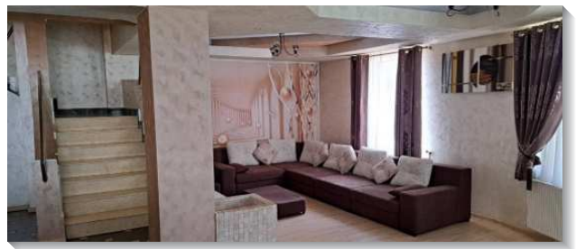
▲羅馬尼亞布加勒斯特購置新會所

為著購買會所的展望和用途，在已過的兩年裏，弟兄們看過了八十多處房產，經過多方的禱告尋求和尋找，找到一處合適的地點，地上三層獨立住宅（不計地下室），室內面積為一百〇四坪。最大的一層是三十五坪，土地面積為一百八十五坪，位於布加勒斯特第四