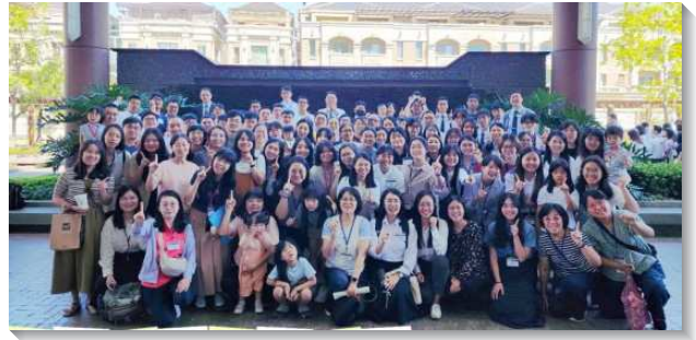
▲ 聖徒們參加青職特會

在交通中提到，不要在魂裏講道理，有位青職聖徒看見自己總是魂裏的感覺太強，找藉口以為是合理的解釋，但這些都阻礙生命的成長。如同約翰福音十二