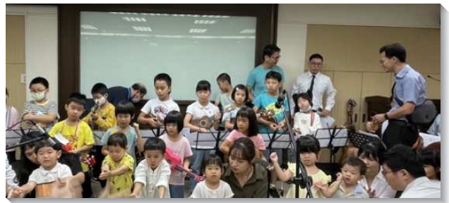
▲ 兒童們在福音聚會中展覽

當天有精彩的展覽，從一歲幼兒到八十多歲的聖徒，一同用烏克蘭麗麗彈奏兩首詩歌。以及一到三歲的幼幼排幼兒背誦詩篇第二十三篇。還有兒童排的家長和子女一同禱讀經節，並分享『生活鼓勵本』的操練。孩子們年紀雖小，但在父母信心的傳輸下，也能藉著禱告解決在學校裏遇到的大小難處。有一位還未得救的媽媽，見證