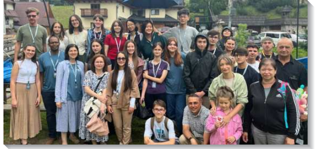
▲羅語聖徒參加歐洲青少年特會

然而迄今，羅馬尼亞還沒有固定的聚會場地。布加勒斯特召會自二〇〇〇年在LME差派到東歐國家移民聖徒建立起燈臺以來，一直是租用公共設施和空間聚會，這些空間都有各種限制。在疫情之後，聖徒們目前使用Rhema-LSM辦公室公寓中有限的空間來聚集，其餘的空間則是儲藏室、打包室和電腦室。這個辦公室幾乎無法容納目前二十位聖徒參加主日聚會，也相當限縮了召會傳福音、增長和向外擴展的功用。