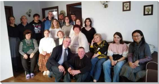
▲羅馬尼亞聖徒參加主日聚會

在俄烏戰爭爆發，烏克蘭難民危機最嚴重的時候，布加勒斯特召會也是烏克蘭聖徒重要的中繼站，並為從海外來此推廣福音的聖徒提供了便利的協助。布加勒斯特召會持續積極的接待 FTTA 和 FTTT 短期的福音開展。布加勒斯特召會對主在東南歐地區的行動相當盡功用，包括舉行疫情後第一次中東歐和巴爾幹半島的特會