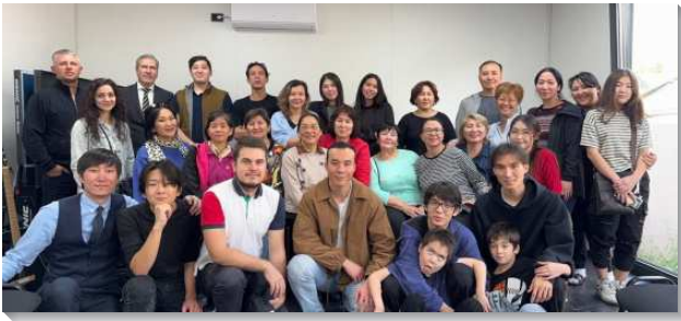
▲聖徒們訪問阿拉木圖的召會

一、九月十四日週六和隔天主日在莫斯科召會及鄰近眾召會有相調特會，看到許多近二十年未見的聖徒及下一代都在召會中配搭盡功用，真是喜樂！這些年大環境