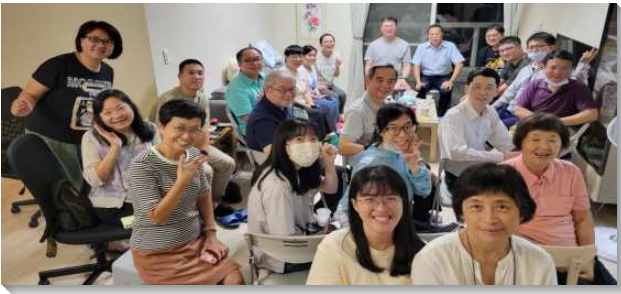
▲聖徒們讀生命讀經享受神聖話語

二十九會所聖徒從去年二月開始進入李常受文集九一四至九七年的書報追求，直至今年一月追求完成。聖徒對於李弟兄所傳講的神聖真理高峰都深覺寶貴和豐富，隨即交通需跟上全台眾召會以二十年共追生命讀經的水流，盼望藉著讀生命讀經、恢復版聖經，帶進聖徒對主話的渴慕及經歷生命的長大。故聖徒自今年二月起照著文山二、三大區的進度，從創世記生命讀經開始追求。創世記是一卷滿了生命種子的書，看見亞伯拉