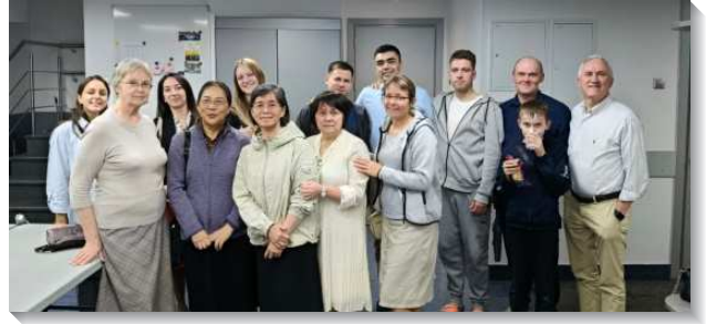
▲聖徒們一同參加禱告聚會

二、我們到聖彼得堡參加每週五的大專聚會，與會者大多是聖徒的兒女。弟兄們交通實行家中牧養，且有負擔爲主培育下一代—兒童、青少年、大專及青職。雖然環境受限制，但是聖徒仍在家中、學校、職場爲神發