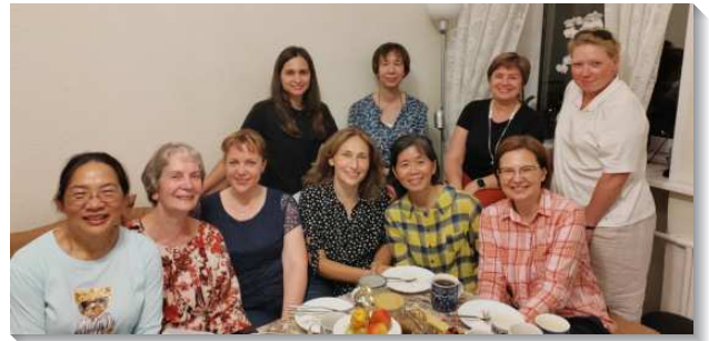
▲在莫斯科的聖徒積極過召會生活

四、九月二十八至二十九日中亞特會，在天山下的吉爾吉斯比什凱克舉行，我們和此地的聖徒已十幾年未見面，大家都很熱切的擁抱問安。以前服事過的青少年現在已三十歲，有的已結婚生子，現今也在召會中配搭。