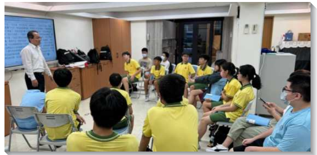
▲聖徒陪伴青少年校園小排

青少年建立每週主日分別歸主的習慣，亦將關懷者個別牧養之得榮少年，邀約到主日聚集中。也有些得少的哥哥姊姊雖然已經是大專生，仍願意為著陪同弟