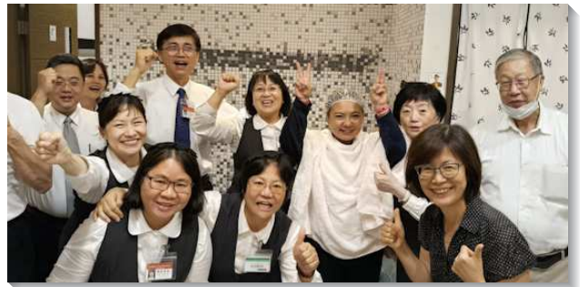
▲壯年班學員到南港傳福音領人歸主

一週開展，服事者以『那帶種子流著淚出去撒播的，必要歡呼著帶禾捆回來（詩篇一二六：6）鼓勵勸勉大