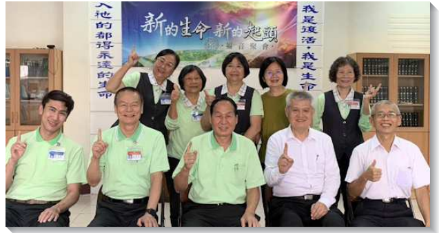
▲壯年班輔訓看望開展學員

突破限制，帶進基督身體的建造：嘉義竹崎召會埋首開展多年，又逢三年的疫情，所以與週邊召會交通相較少。此次開展有嘉義市召會二個大區的聖徒來竹崎配