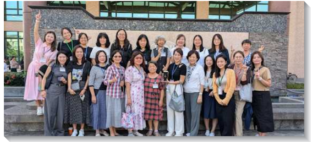
▲姊妹們參加全台事奉相調特會

息很摸著她的全人。信息提到，我們需要操練過深處的生活、有深處的經歷，過『往下扎根、向上結果』的生活，要像根出於乾地，且需要學習運用否認己、背十字架及喪失魂生命三把鑰匙，關上陰間的門以建造召會。