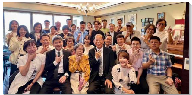
▲聖徒同過甜美喜樂的召會生活

會所第一區主日聚會地點是在聖徒的家中，開家的聖徒福音的靈很強，不僅傳福音帶人得救，更為著結常存的果子。每週主日聚會有四、五十位聖徒和福音朋友來聚集，從擺放座椅、豫備詩歌、中午愛筵，還有下午