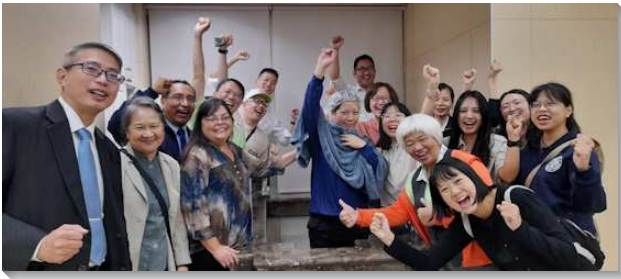
▲壯年班學員在台北帶人受浸得救

以下為幾項蒙恩：合一的配搭，爭戰的禱告，帶進神的祝福：開展前，各隊在線上與當地召會交通禱告，同心合意豫備此次開展。甚至有姊妹們每天八個時段照名單為人禱告，不僅殷勤耕耘當地，更顯示出超越的行動力。各隊到了開展地，在那靈的引導下，堅定持續的禱