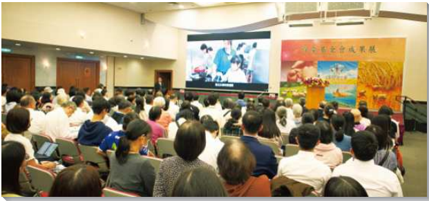
▲得榮基金會成果展在信基大樓舉行

弟兄亦以馬太福音六章六節勉勵眾人，因著許多的關懷者在隱密中施捨、禱告、禁食，照顧少年，才有今日的成果展。近日，基金會也透過聖徒們的協助，請教育局發函給高職、五專和各級學校的家長會，期盼藉此在得榮少年專案上帶進少年的繁殖與擴增。