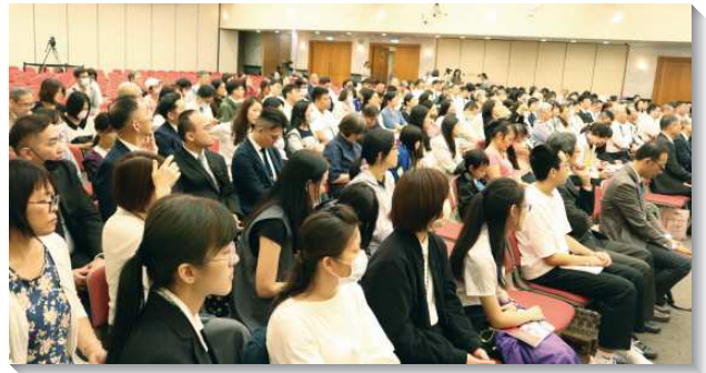
▲全台關懷者牧養得榮少年

台中大區得榮少年見證，藉著專案，少年家人先後受浸，全家得救。少年對聖經非常渴慕，與弟兄姊妹天天讀聖經，於今年五月已將新、舊約讀完一遍。關懷者也分享該名得榮少年，是其在校園傳福音最好的配搭。得