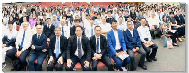
▲聖徒配搭得榮少年教育專案

在各大區分享見證之後，弟兄感謝全台所有的關懷者，若沒有關懷者們在神的愛中堅定持續關懷、照顧得榮少年，這麼多甜美感人的見證無法一直複製下去，特別是藉此也讓得榮少年及家人認識是愛的神。