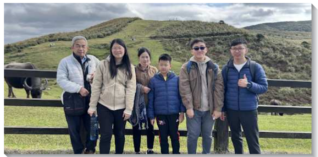
▲聖徒配搭服事得榮少年的家

我們為著得少這條傳福音的路感謝主，我們願意和眾聖徒在元首基督帶領下繼續將人帶進神愛子的國裏，願這四個得榮少年的家早日全家得救。（張凱鈞）