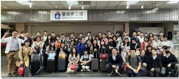
▲大安區聖徒們至花東各地開展

大安區有一百三十六位青職和七十四位大專生及部分社區聖徒，於十月十一至十三日前往花蓮及台東二十八處鄉鎮開展。本次開展係回應花東聖徒於五月初到大安區訪問相調，並期盼大安區聖徒有機會前去花東地區相調。本次開展於六月底即開始豫備，在豫備上著重主恢復的三個實質：『禱告，那靈與話』。從八月底各開展隊密集與花東當地聖徒一同線上禱告，為著豫備探望的所有對象禱告，也促使兩地聖徒有更多相調，帶進真實的建造。開展聖徒們於十